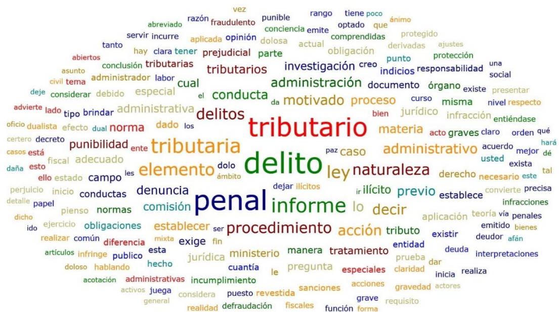
Nube de palabras

La figura 3, muestra las palabras de mayor trascendencia en cuanto a la presente investigación. Observándose como resultado que las palabras: delito, tributario y penal evidencian mayor utilización dentro del campo jurídico en esta materia especial.