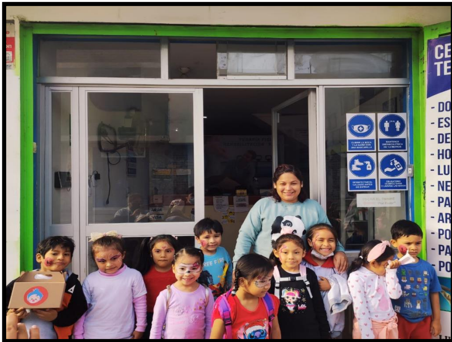
Fiesta de clausura, los niños se pintaron la carita