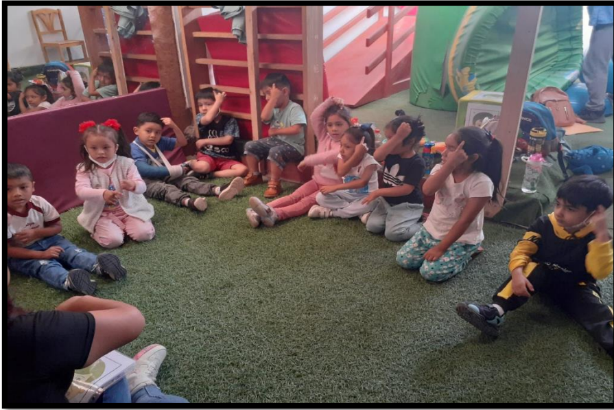
Los niños realizaron los movimientos según la canción