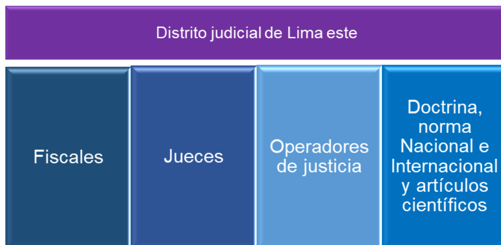
Figura 1: Mapeamiento

libertad de realizar un pequeño resumen del tema de investigación, incluso le da independencia al investigador de poder plantear interrogantes que nazcan al instante, con el propósito de ahondar más en el estudio.