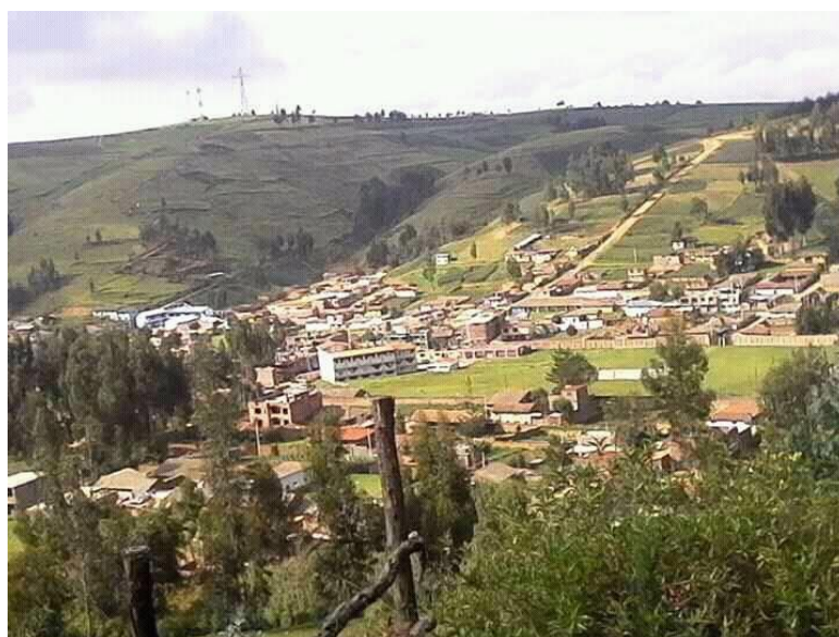
Figura 1: Estadio principal, Anexo de Cochas Chico.