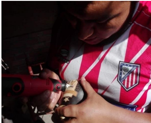
Figura 25: Practica de técnicas artesanales

diseños nítidos y con dibujos de la costa, sierra y selva.