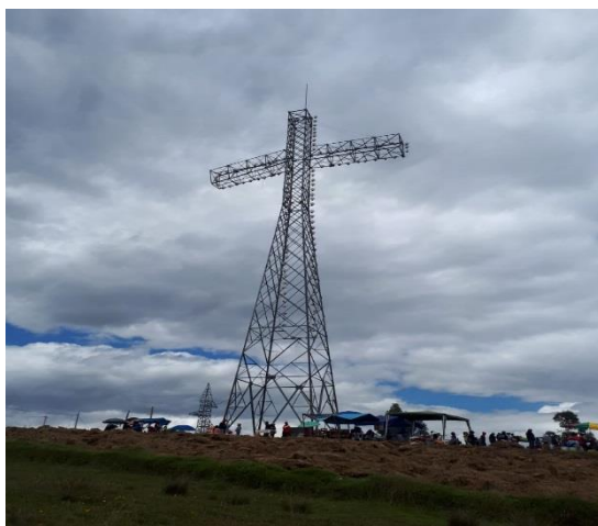
Figura 11: La cruz de la paz

Actualmente no se encuentra muy bien cuidado por los constantes robos de sus torres de electricidad.