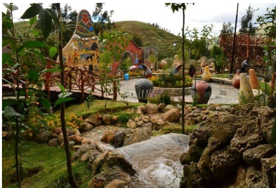
Figura 10: El parque de los mates burilados