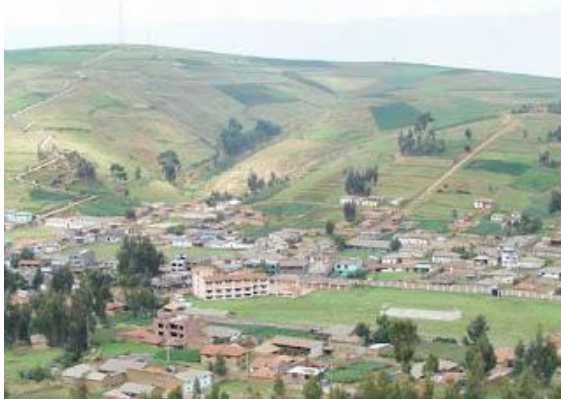
Figura 16: El cerro Achkamarca

En la actualidad es el cerro más llamativo de esta comunidad, ya que, cuenta varias hectáreas de un verde pálido en verano y en invierno suele ser el más verdoso. Llamado también el cerro que lo ve todo porque desde ahí, se puede contemplar a Cochas Chico con una vista panorámica.