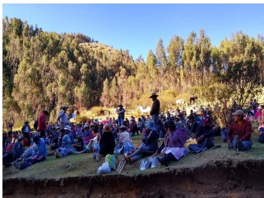
Figura 20: Participación de los comuneros