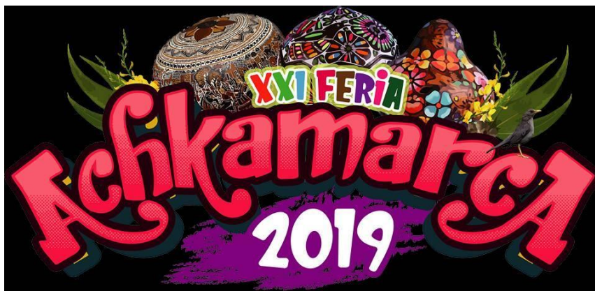
Figura 6: Logo de la feria de Achkamarca.