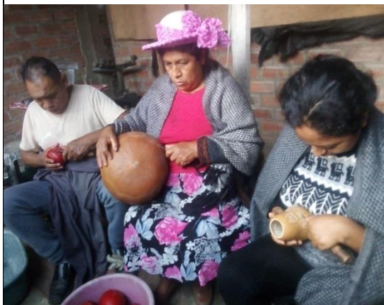
Figura 26: Participación familiar

En referencia a la realización de las practicas artesanales se pudo ver que esta familia aún conserva lo tradicional, con la elaboración del enserado, quemado con fuego, el echarle acido para darle color al mate, el quemado con carburo entre otros. Son técnicas tradicionales que hace que los talleres producen sus artesanías con tradición y costumbre.