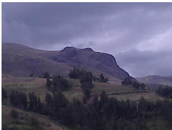
Figura 14: El rostro de cristo

En la actualidad no está totalmente conservada, ya que se puede ver el abandono por parte de la comunidad. Pero la naturaleza hace que estas ventanillas se vean deslumbrante con la conexión con la naturaleza.