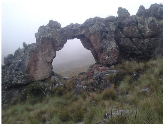
Figura 13: Ventanilla de piedra

En la actualidad no está totalmente conservada, ya que se puede ver el abandono por parte de la comunidad. Pero la naturaleza hace que estas ventanillas se vean deslumbrante con la conexión con la naturaleza.