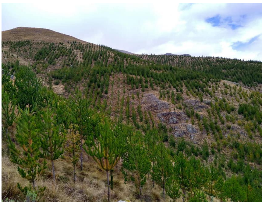
Figura 5: Parque Ecológico de los Pinos