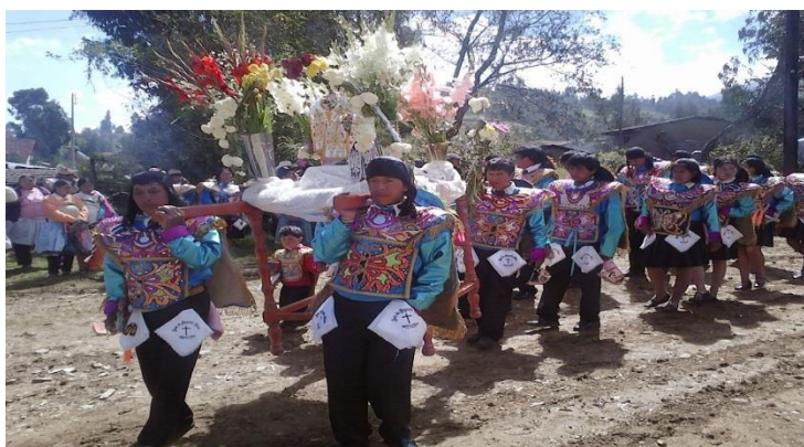
Figura 3: Danza de Honor al tayta mayo

En otros aspectos más destacados del anexo de Cochas Chico es la manifestación de sus diferentes danzas costumbristas especialmente en la iglesia de 12 de mayo a honor al “tayta mayo” donde representan sus danzas al son de la banda de quienes valoran, difunden y fortalecen su cultura que simboliza mediante estas representaciones que son relevantes al exhibir su cultura viva, estas festividades son de gran importancia para esta comunidad, siendo la víspera de mayordomía con diferentes danzas costumbristas que al llegar saludan a la “santísima cruz de mayo” e inician la gran velada del patrón “tayta mayo”, luego se inicia la presentación y demostración de sus cuadrillas al son de la música y la quema de los fantásticos cotillones acompañado de los flameantes toritos y cohetes en plena celebración.