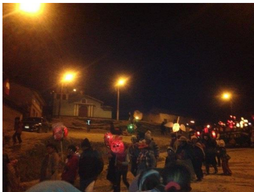
Figura 21: Actividades culturales