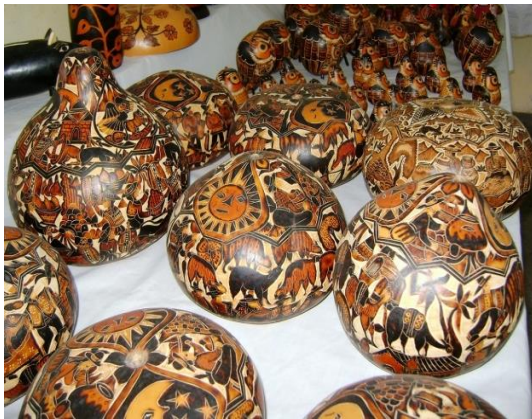
Figura 18: Los mates burilados

En la actualidad, los mates burilados es uno de los patrimonios tangibles más representativos de esta comunidad, el valor que representa sus dibujos, tallados que son expresiones que caracteriza sus vivencias, costumbres que hace que esta comunidad se sienta orgullo por su riqueza cultural.