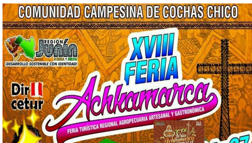
Figura 2: Representación del anexo de cochas chico.

vista de turistas a la comunidad (Hurtado, 2003. P. 23).