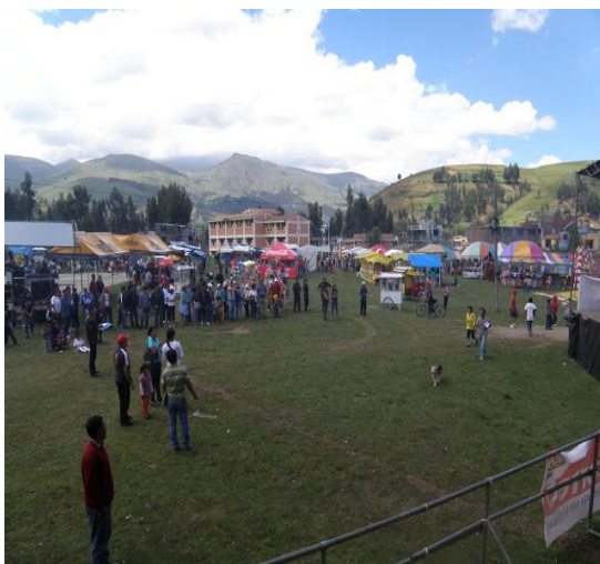
Figura 17: Feria de Achkamarca

En la actualidad es el cerro más llamativo de esta comunidad, ya que, cuenta varias hectáreas de un verde pálido en verano y en invierno suele ser el más verdoso. Llamado también el cerro que lo ve todo porque desde ahí, se puede contemplar a Cochas Chico con una vista panorámica.