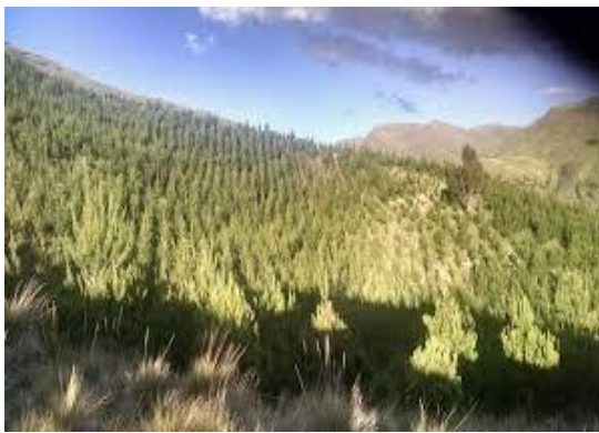
Figura 19: El parque ecológico de los pinos

En la actualidad, los mates burilados es uno de los patrimonios tangibles más representativos de esta comunidad, el valor que representa sus dibujos, tallados que son expresiones que caracteriza sus vivencias, costumbres que hace que esta comunidad se sienta orgullo por su riqueza cultural.