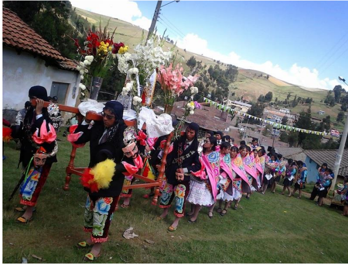
Figura 4: Danza de la chonguinada.