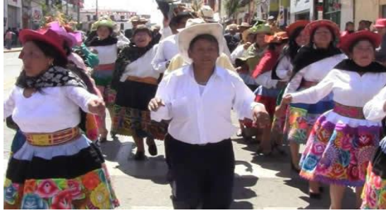
Figura 22: Manifestaciones tradicionales