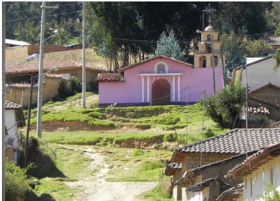
Figura 15: Iglesia Virgen del Valle

Hoy por hoy, se encuentra regularmente conservada, dado que: