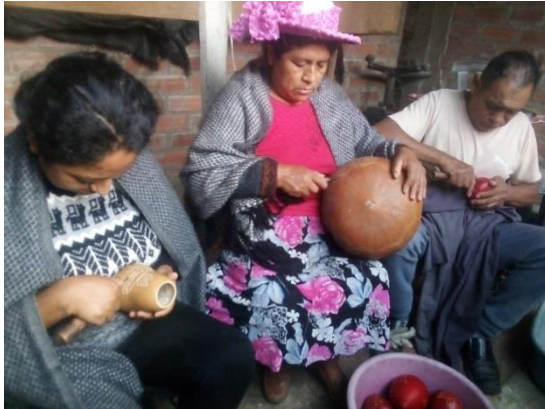
Figura 23: Proceso del burilado