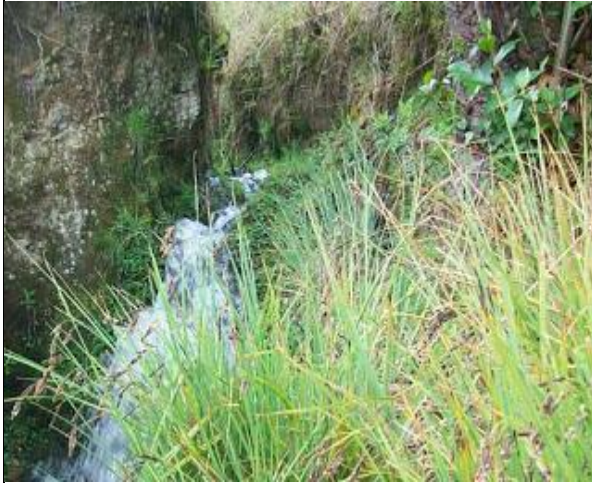
Figura 12: Manantial chuyo

Actualmente se encuentra pésimamente conservado, ya que: