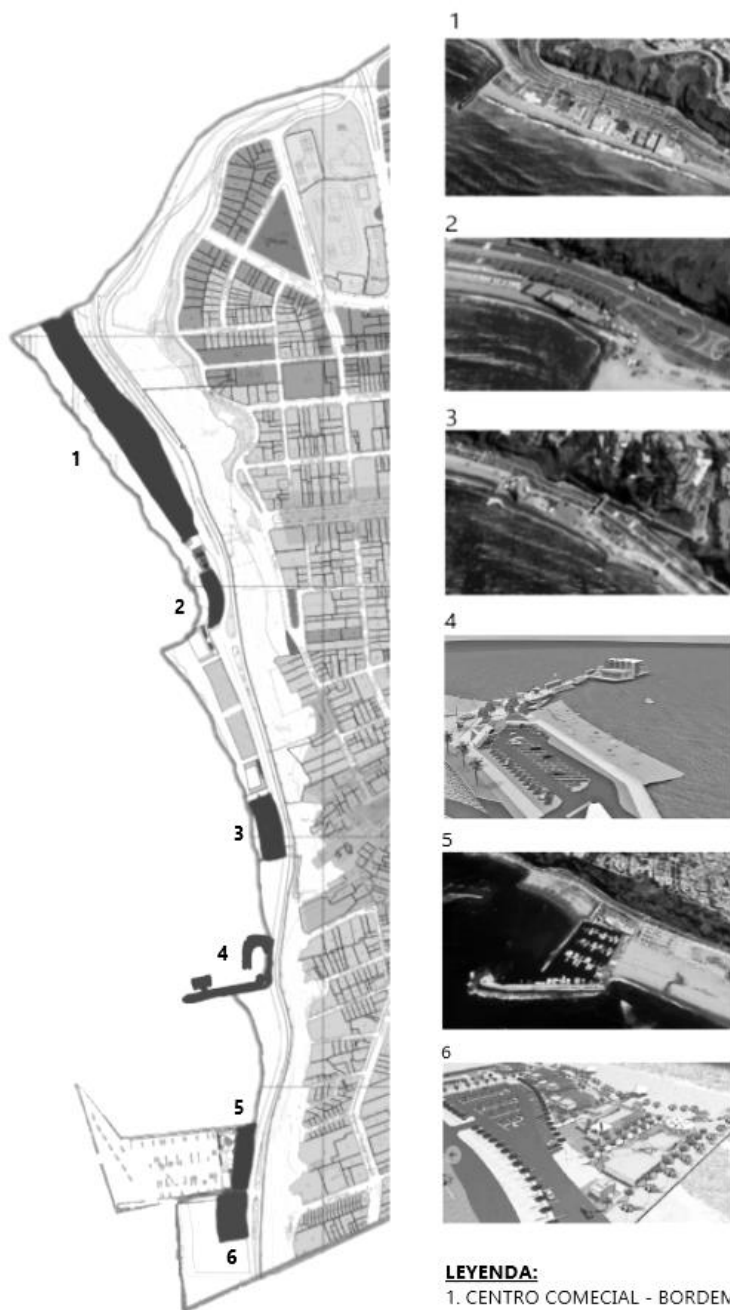
Figura 1: Enclaves fragmentando las playas de Barranco