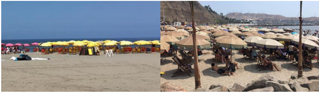
Figura 2: Lotización a través del alquiler de sillas y sombrillas en las playas. Las sombrillas y los yuyos, de izquierda a derecha respectivamente