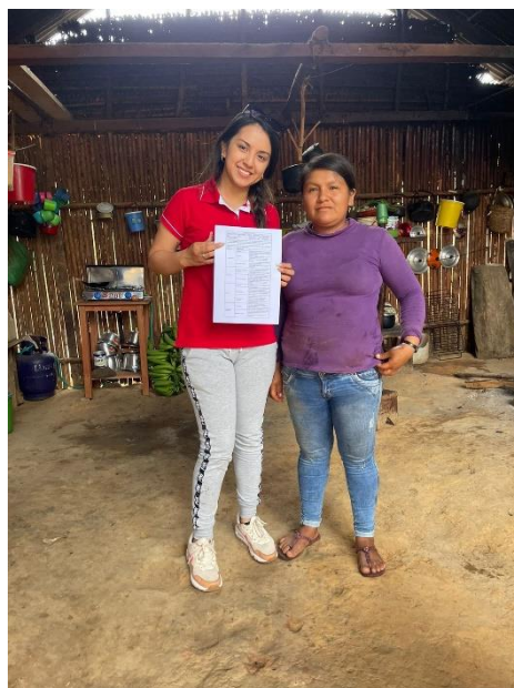
Figura 15. Foto a Emerita