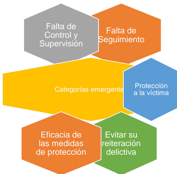
Figura 2 Categorías emergentes del objetivo específico 01

Por ello, en la pregunta ocho considera usted la modificatoria del artículo 368 del Código Penal para evitar conflictos normativos, los expertos han señalado que sí, a efecto de evitar la figura del concurso aparente de normas, aunado a ello, se concluye que la parte investigada será sancionado por ambos ilícitos penales, el primero que hace alusión al de menor gravedad, en la cual se penaliza la acción ante un no cumplimiento de una medida otorgada por el ente judicial, del mismo modo, se sanciona a través del artículo 368 del Código Penal, cuando no se cumple una orden emanada por el ente judicial.