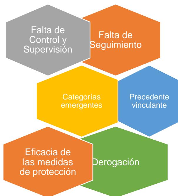
Figura 3 Categorías emergentes del objetivo específico 02

En torno a ello, desde un contexto en base a la doctrina, Curro (2017), determina que cualquier tipo de entidad que advierta el cumplimiento de tales medidas, mantiene la capacidad de informar tales hechos a la entidad judicial correspondiente dentro de un término de 24 horas, bajo responsabilidad que éstas no se cumplan por parte del agresor.