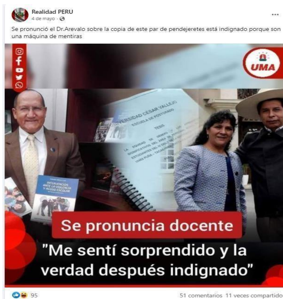
Figura 3: “Pronunciamento del docente sobre la acusación de plagio que recae en Pedro Castillo”