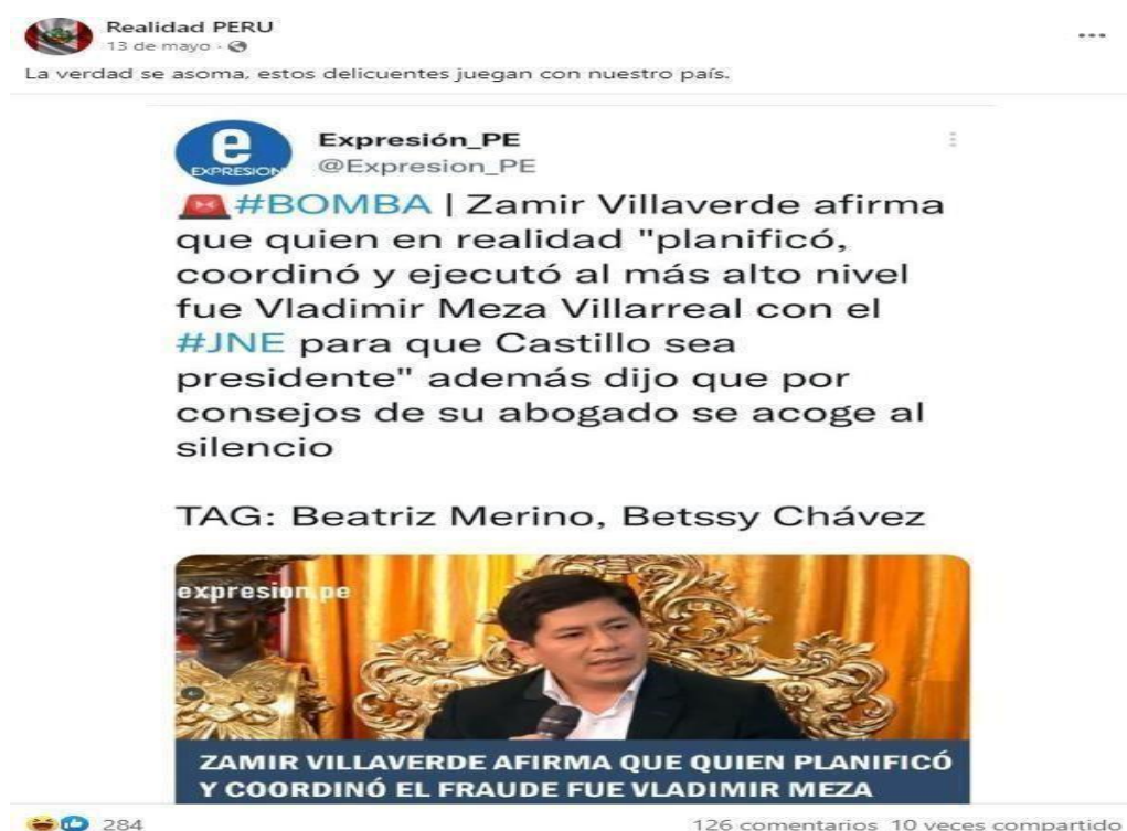
Figura 6: “Zamir Villaverde afirma fraude con el Jurado Nacional de Elecciones para que Pedro Castillo ganara las elecciones”