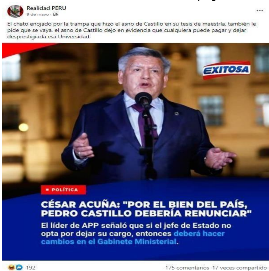
Figura 4: “Pronunciamiento de Cesar Acuña sobre plagio de Pedro Castillo”