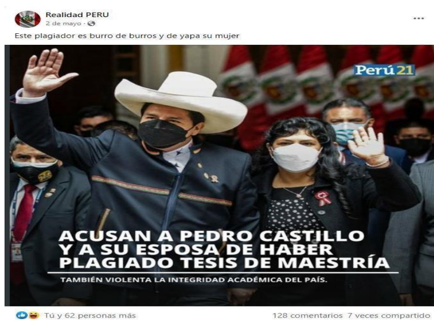
Figura 1: "Acusan a Pedro Castillo y a su esposa de haber plagiado tesis de maestría"