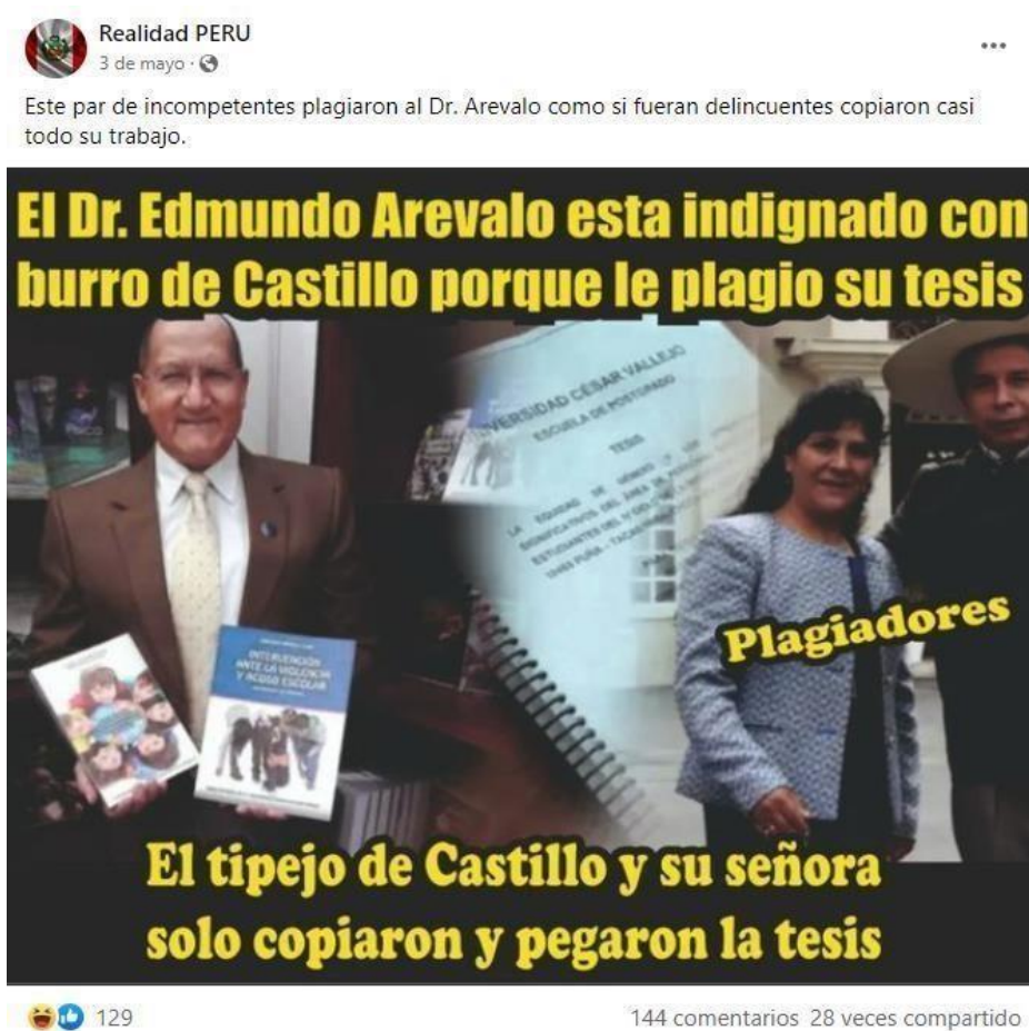
Figura 2: “Comentarios sobre la acusación de plagio dirigidos a Pedro Castillo”