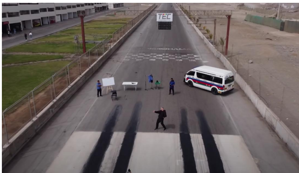
Captura de pantalla del video de la fecha 5 de junio de 2022

“COBRADOR DE COMBI POR UN DÍA!!” (video del canal IOA)