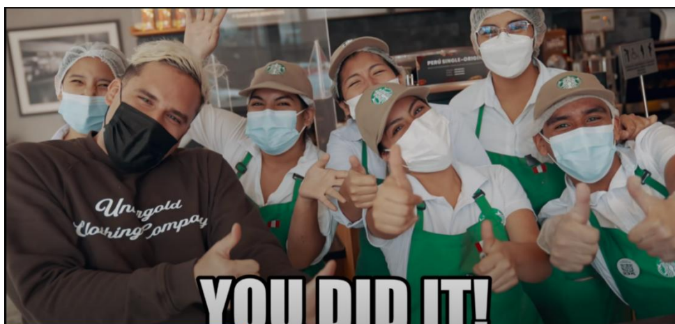
Captura de pantalla del video de la fecha 15 de mayo de 2022

"LES DOY $1,000 DÓLARES Si Escriben Bien Mi APELLIDO en Starbucks!" (video de YouTube)