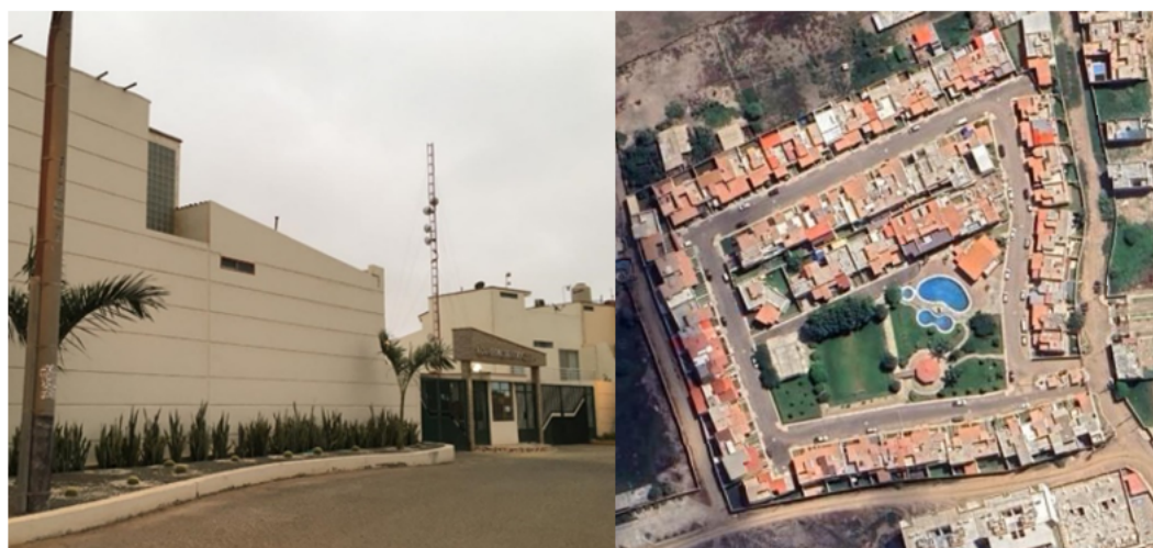
Figura 2: Vistas de tipo de Urbanización: Country Club.

Alameda Country club está ubicada en la expansión urbana de Pimentel, es una urbanización cerrada cuenta con viviendas unifamiliares y la segunda etapa son edificios multifamiliares, con una completa infraestructura de servicios, y un 40 % de la su superficie destinada a espacios recreativos, deportivos y de esparcimiento. Los controles de seguridad son desde la entrada. Destinada para grupos sociales de nivel alto. (Figura 2).