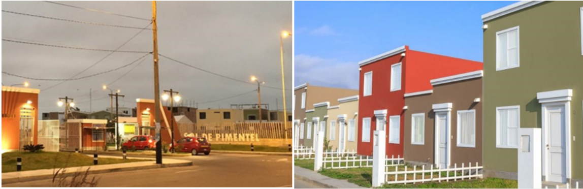
Figura 3: Vistas de tipo de Urbanización: Barrio Cerrado.

Condominio el sol de Pimentel de la empresa constructora Galilea, es de uso residencial exclusivo, con cerramiento amurallado y rejas, cuenta con una tipología de vivienda de diseño exclusivo, sus módulos de áreas mínimas, de tipo flat y dúplex, no cuenta con infraestructura de servicios recreativos ni deportivos, tiene un área mínima destinada a parques y vías de acceso a las viviendas. Esta empresa constructora tiene proyectos inmobiliarios a nivel nacional trabaja para favorecer a sectores sociales medio las familias se benefician con el bono familiar otorgado por el gobierno mediante el Fondo mi Vivienda. (Figura 3).