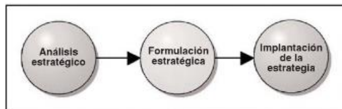
Figura 1: Elaborado por Martínez y Milla

Martínez y Milla (2012), indican que “el planeamiento estratégico se divide en tres etapas fundamentales: el análisis estratégico, formulación estratégica y implantación de la estrategia” (p.13).