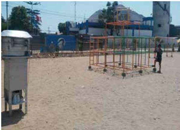
Figura N° 1. Ubicación del equipo de muestreo de contaminantes en el parque Dinosaurio.

Las fuentes de emisión industriales identificadas fueron las siguientes: