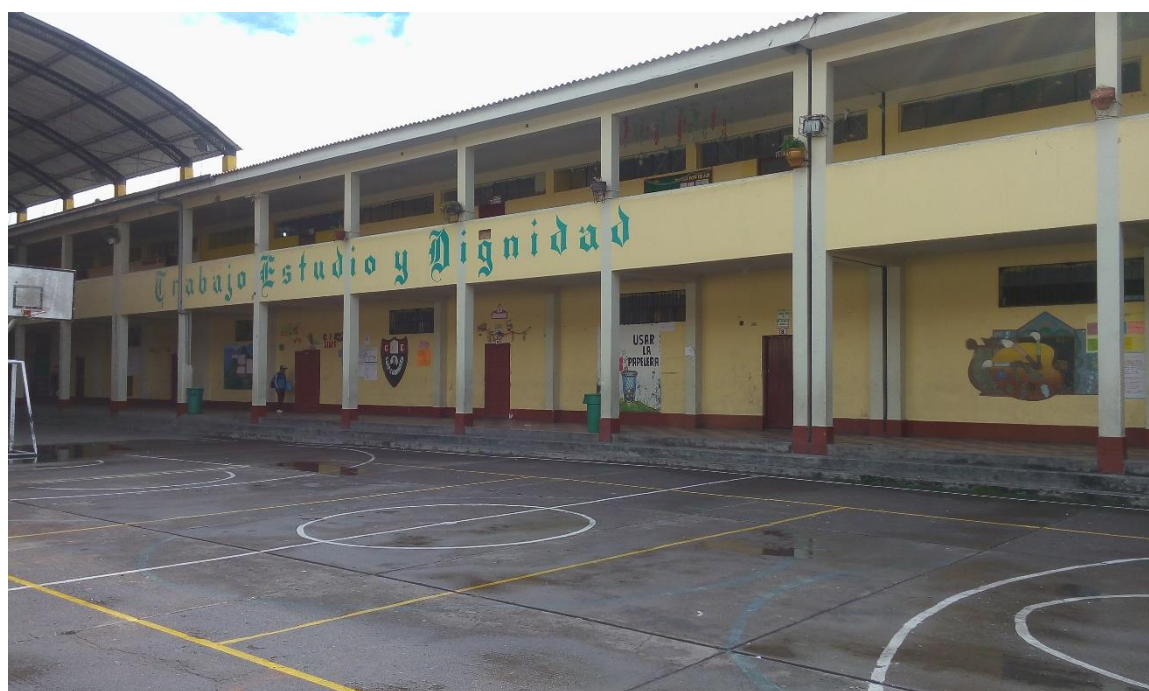
Interior de la Institución Educativa "Luis Carranza" donde se aplicó la ficha de observación de las habilidades sociales y atención en estudiantes. Ayacucho, 2017