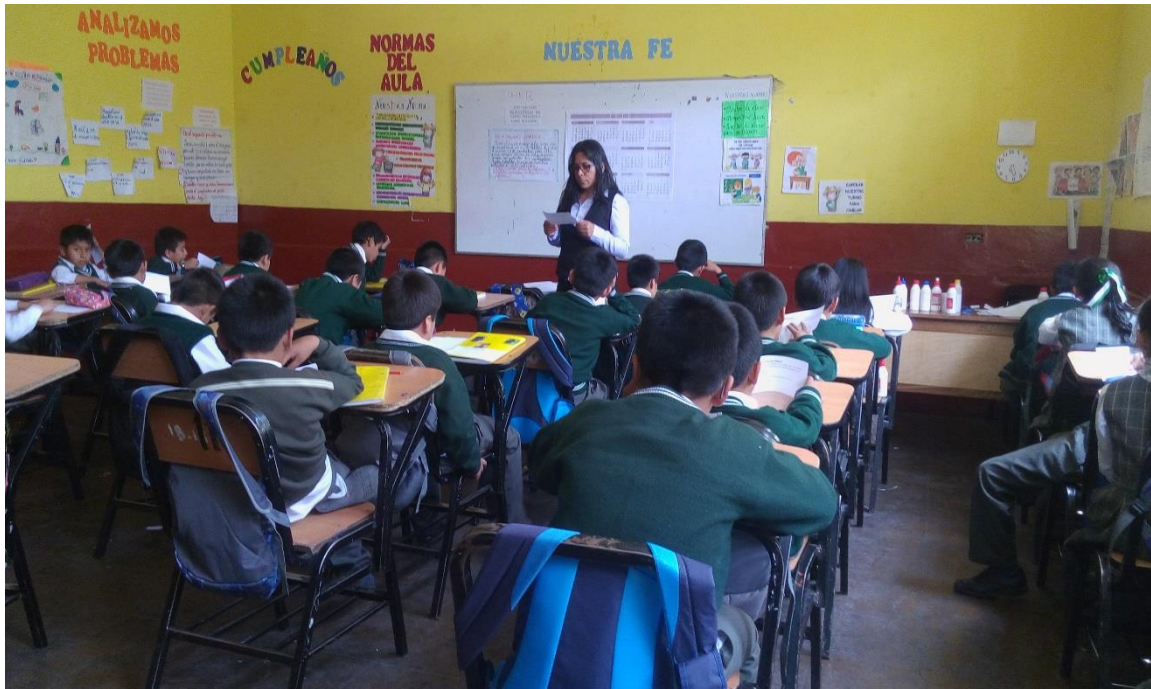
Estudiantes de cuarto grado "B" de la Institución "Luis Carranza" respondiendo a las preguntas de la ficha de observación. Ayacucho, 2017