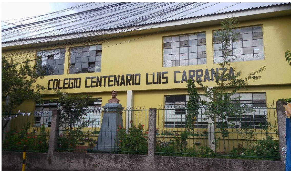
Exterior de la Institución Educativa "Luis Carranza" Ayacucho, 2017