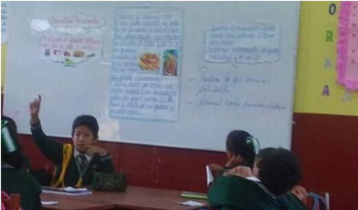
Estudiantes de cuarto grado "B" de la Institución "Luis Carranza" opinando con asertividad en la clase. Ayacucho, 2017