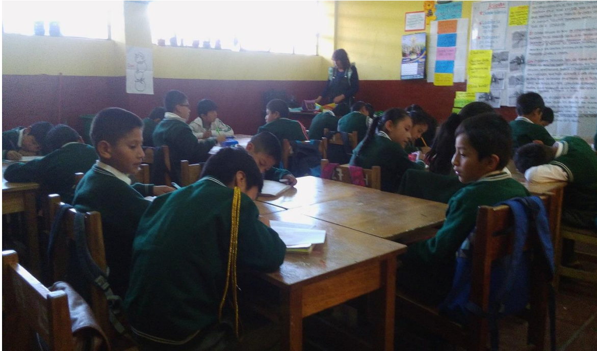
Estudiantes de cuarto grado "B" de la Institución "Luis Carranza" dominando las habilidades sociales y la atención. Ayacucho, 2017