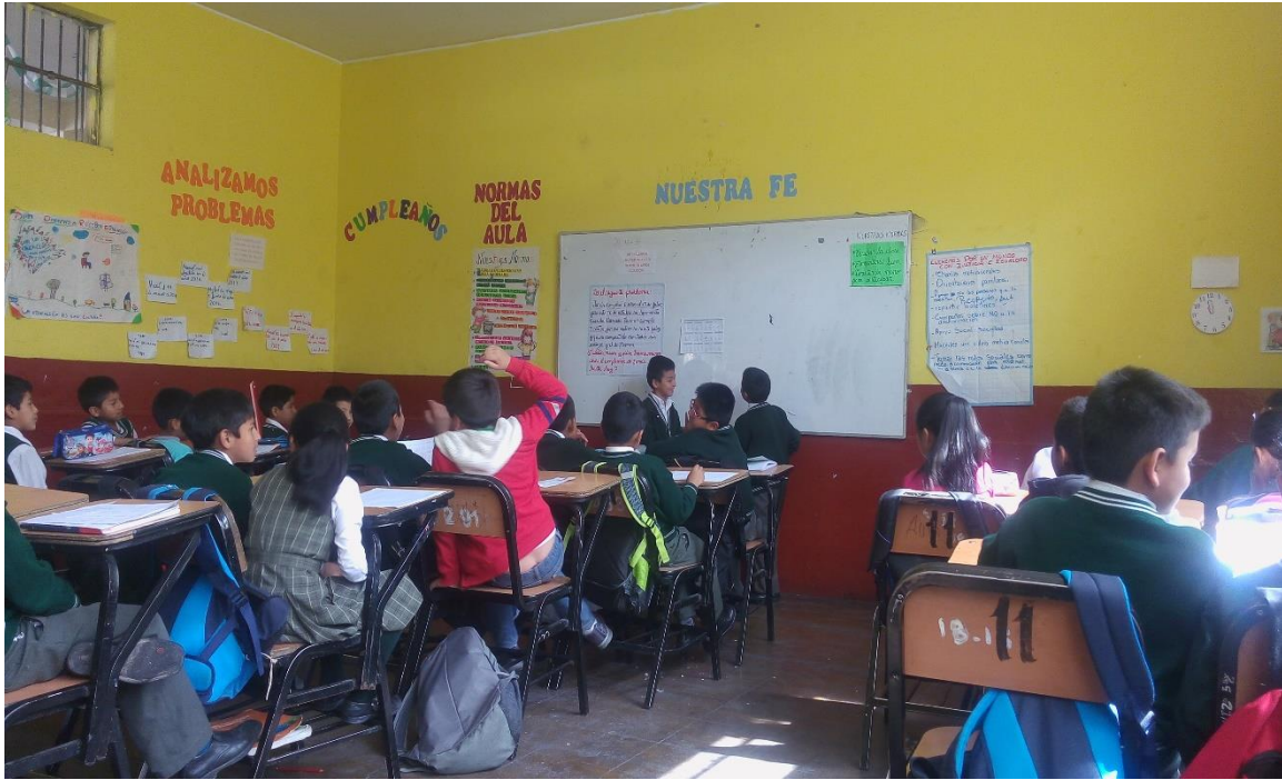
En el aula de cuarto grado "B" Un niño lee el texto del papelote, mientras el resto de los estudiantes conversan entre ellos, no se observa atención a la lectura. Ayacucho, 2017