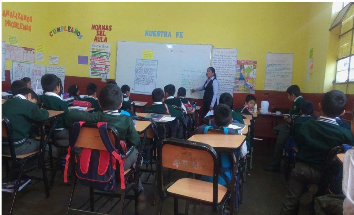
Estudiantes de cuarto grado "B" de la Institución "Luis Carranza" durante el desarrollo de la clase practicando la habilidad social y la atención. Ayacucho, 2017