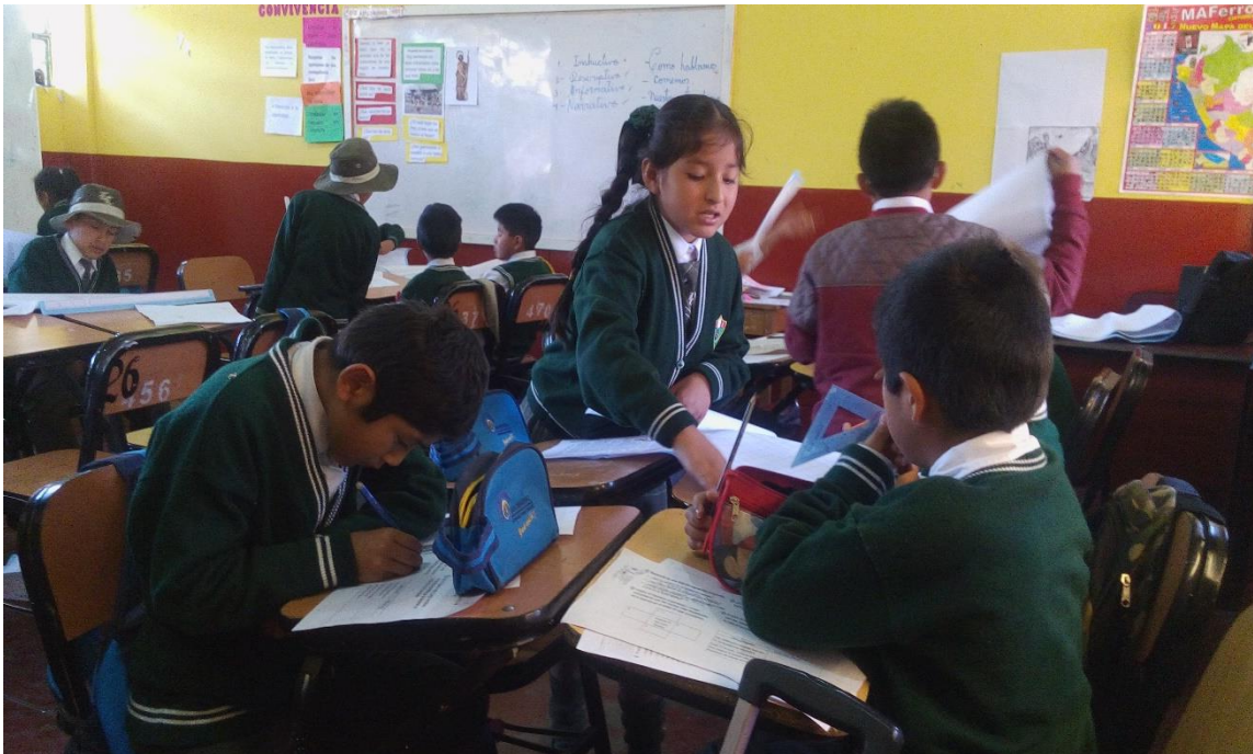
Estudiantes de cuarto grado "B", tienen dificultades para la habilidad social en trabajos grupales. Ayacucho, 2017