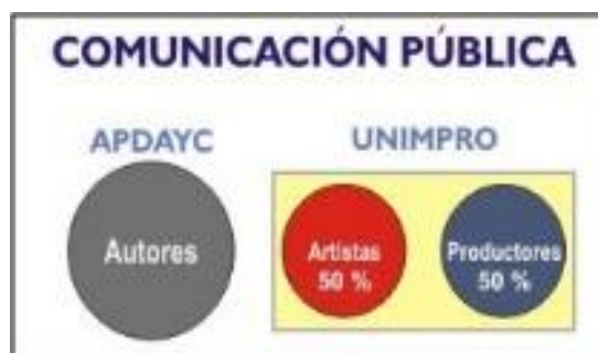
Figura 1. Comunicación Pública