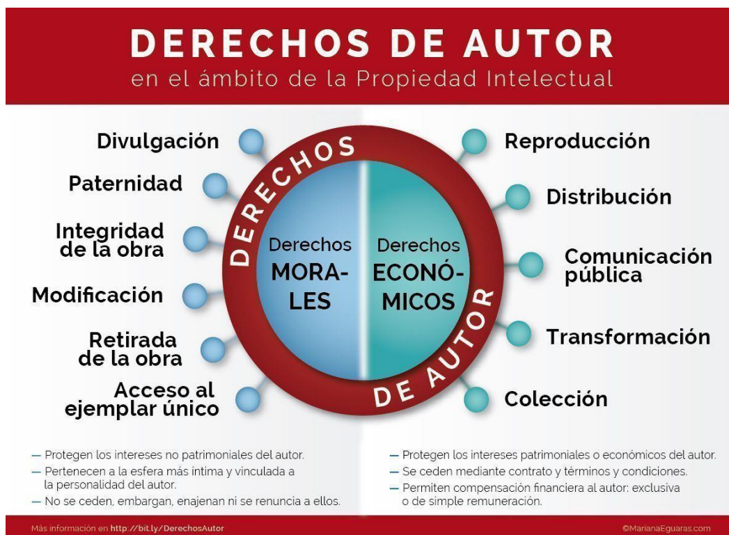
Figura 2. Derechos Patrimoniales y morales

Otro de los autores nos señala que el derecho patrimonial se refiere a todas las formas conocidas o por conocer, ya que se va dar la explotación comercial de la obra y se da mediante la limitación del tiempo, por otro lado, los derechos morales, se dan por la relación personal de autor y su obra, así se va constituir en derechos personalísimos y por ende inalienable, irrenunciable e imprescriptible. Estos derechos deben ser protegidos con la nueva actualización de la tecnología, para que no se vulnere el derecho de autor (Woolcott y Florez, 2014, p. 16).