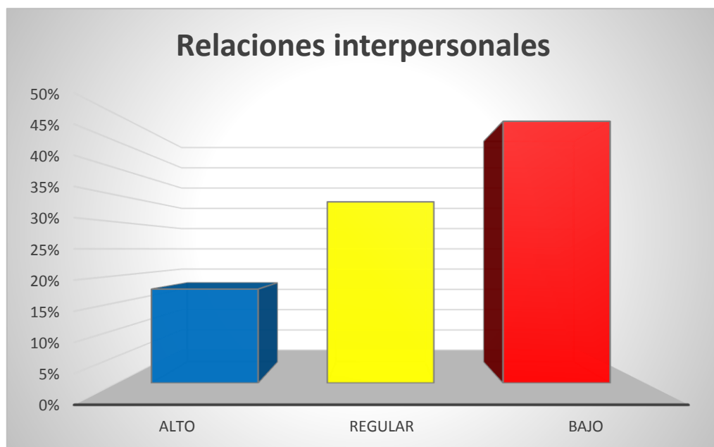
Figura n.º 4: Nivel porcentual de la dimensión Relaciones interpersonales en estudiantes de quinto año de Educación Secundaria