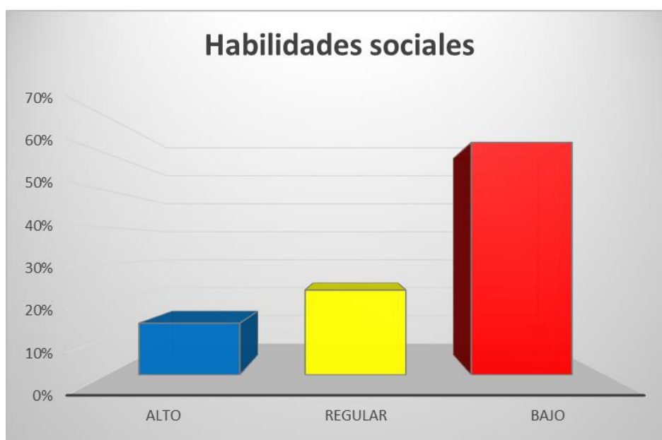
Figura n.º 1: Nivel porcentual de Habilidades sociales