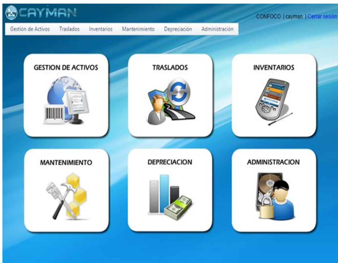
Figura 2. Sistema de activos fijos