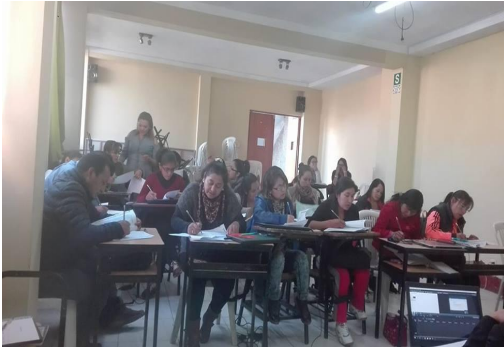
Imagen 4: Agradecimiento al profesor de aula por la ayuda prestada, en el trabajo de investigación.