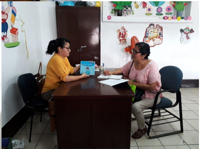
Entrevista a coordinadora