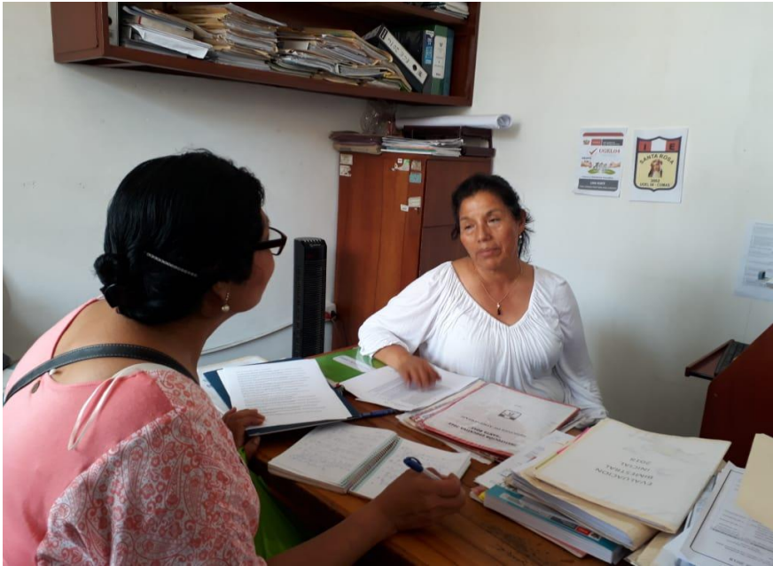
Entrevista a sub directora