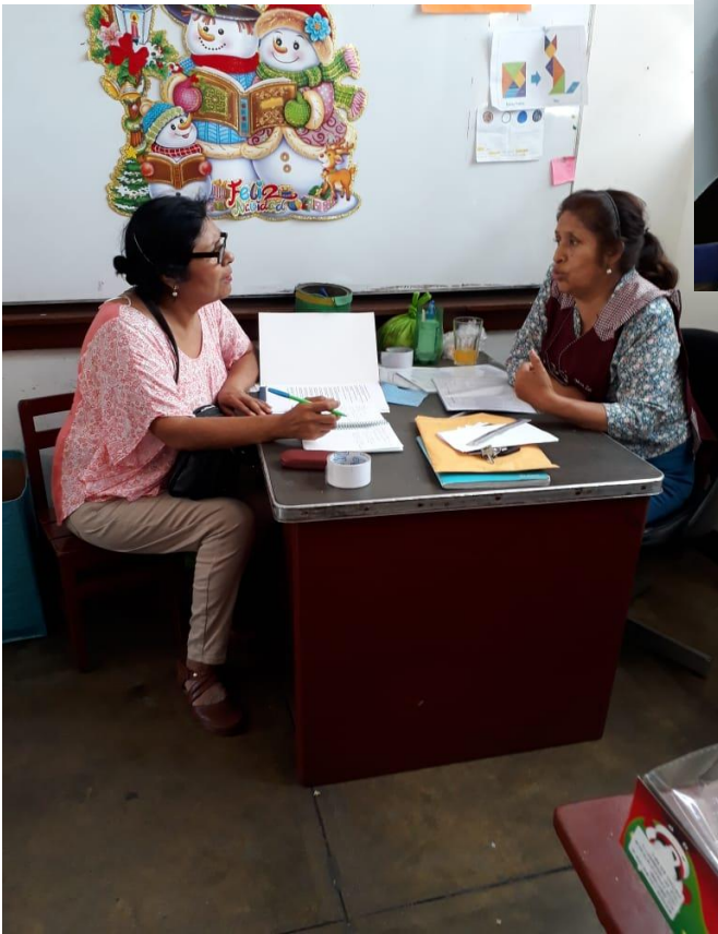
Entrevista a docente