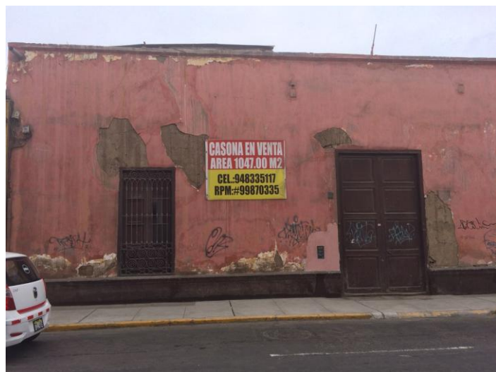
Autor: Martin Abraham Ramírez Ruiz Fachada de la casona ubicada en el Jr. San Martín cuadra # 6 Muchos de los bienes inmuebles del Centro Histórico están puestos en venta ya que sus propietarios no cuentan con los recursos suficientes para darle el mantenimiento y conservación.