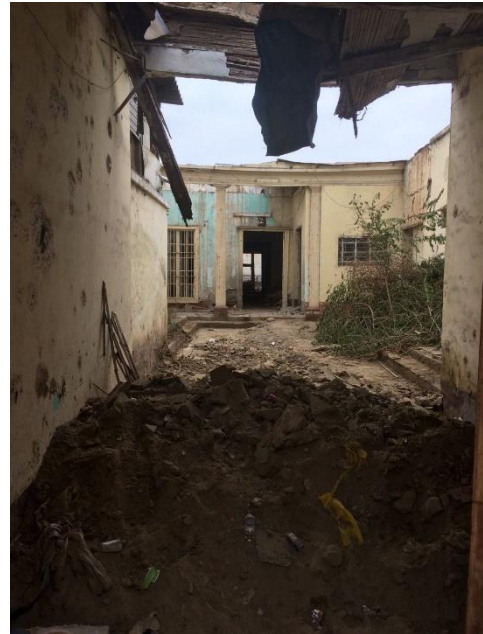
Autor: Martin Abraham Ramírez Ruiz Fachada de la casona ubicada en el Jr. Independencia cuadra # 6 Evidenciamos que muchas de las casonas, en su interior se encuentran en estado decadente, perdiéndose consigo el testimonio vivo de nuestra historia y cultura