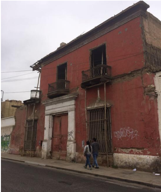
Autor: Martin Abraham Ramírez Ruiz Fachada de la casona ubicada en el Jr. San Martín cuadra # 8 En la presente fotografía podemos evidenciar una vez más a una pareja que transita al borde de estas edificaciones catalogadas como Patrimonio Cultural, la cual es apreciable que se encuentra en un estado crítico ya que los balcones están apuntalados con palos y en toda la vía pública, esto para supuestamente prevenir que esta edificación no colapse.