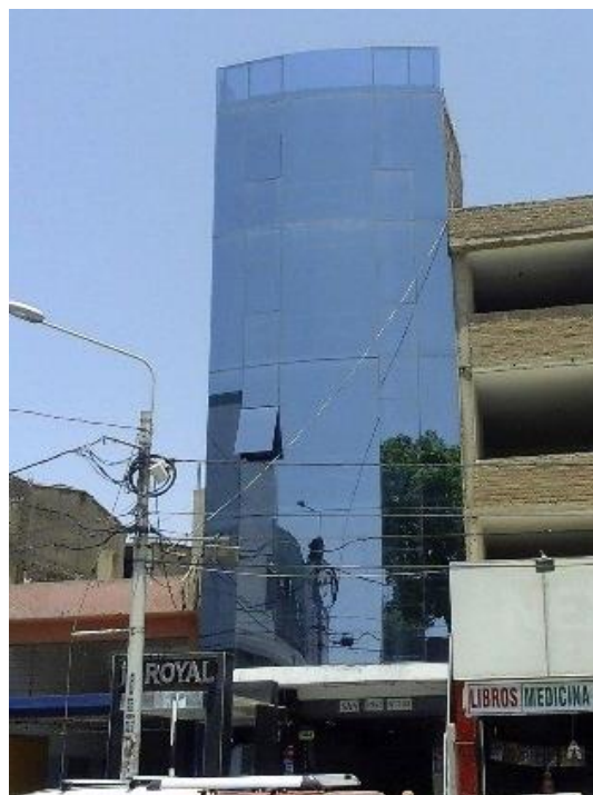
Figura 4. La ausencia de una actitud decolonial en el lenguaje arquitectónico del Distrito de Chiclayo no contribuye al regionalismo (edificio en calle San José, cuadra 3).