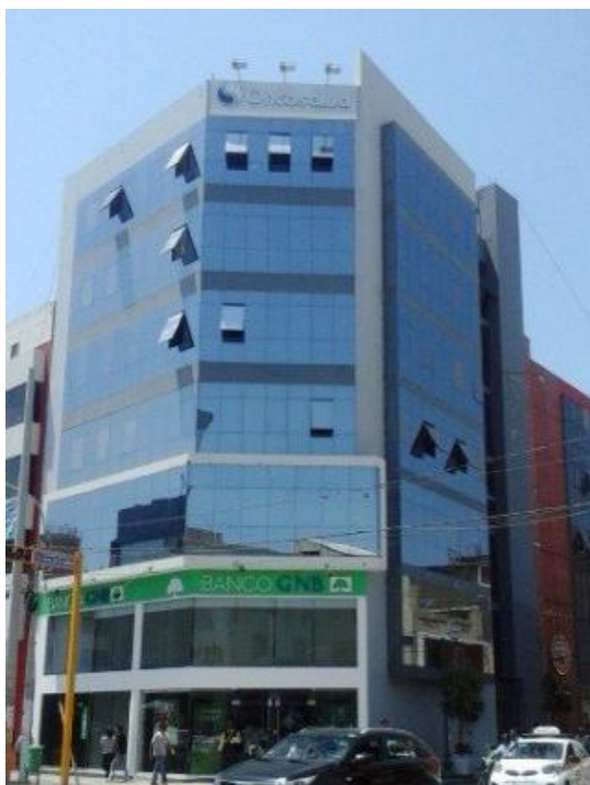
Figura 3. La razón instrumental ha hecho desaparecer el concepto de control solar en el lenguaje arquitectónico del Distrito de Chiclayo (edificio en Av. Balta, cuadra 5).