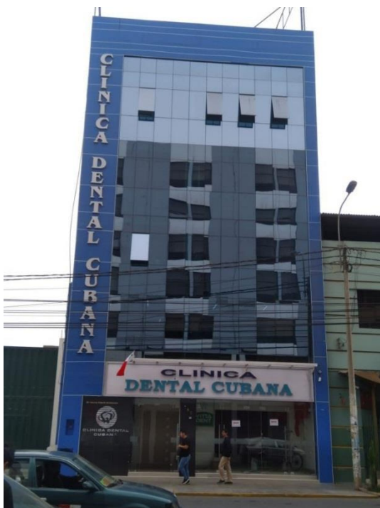
Figura 7. ¿Hay confort térmico sin necesidad de equipos de aire acondicionado en los espacios interiores de este tipo de edificios? (edificio en Av. Bolognesi, cuadra 7).