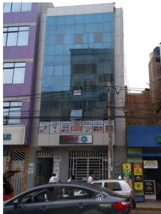
Figura 20. Estos edificios crean la falsa imagen mental de progreso y modernidad (edificio en calle Luis Gonzáles, cuadra 8).