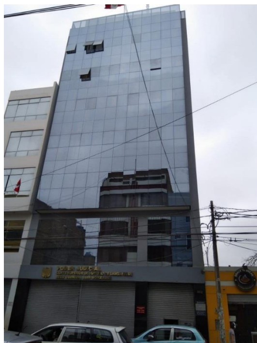
Figura 6. El concepto de lugar ha desaparecido del lenguaje arquitectónico del Distrito de Chiclayo (edificio en calle Luis Gonzales, cuadra 9).