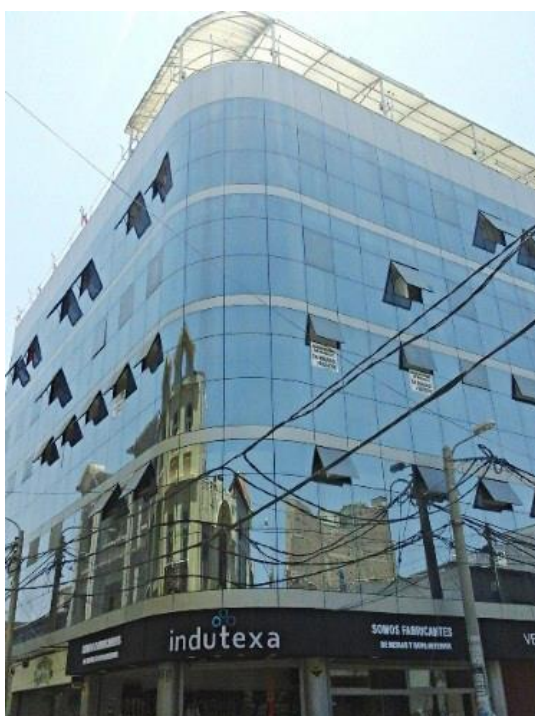
Figura 1. La universalización y la descontextualización son notorias en el lenguaje arquitectónico del Distrito de Chiclayo y esto recuerda al concepto de industria cultural del que hablaban Horkheimer y Adorno (edificio en calle Elías Aguirre, cuadra 4).

En esta investigación no se hacen críticas a personas, sino a paradigmas arquitectónicos, por tanto, no se nombra a los arquitectos autores de los edificios que aparecen en las fotografías. Se respeta a los autores de los edificios que siguen en las siguientes páginas; pero se declara que se discrepa de sus maneras de producir lenguajes arquitectónicos no compatibles con el lugar. Es decir, los edificios en cuestión son planos, sin estudios de asoleamiento, sin esos dispositivos de control solar externos que permiten crear fachadas con profundidad que contrarrestan el asoleamiento chiclayano.