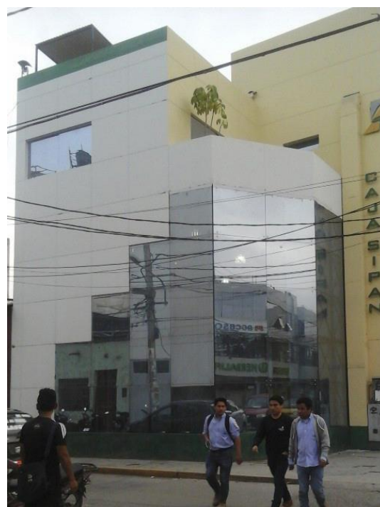
Figura 22. Estos 'edificios espejo' molestan la visión (edificio en Av. Balta, cuadra 2).