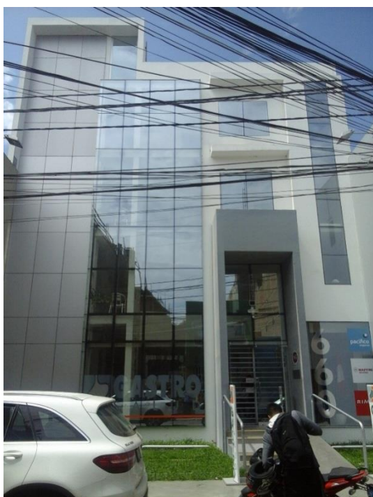
Figura 25. Estos edificios parecen televisores (edificio en calle Alfonso Ugarte, cuadra 6).