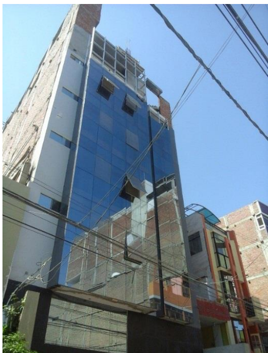
Figura 5. El lenguaje arquitectónico del Distrito de Chiclayo influido por el eurocentrismo (edificio en calle Francisco Cabrera, cuadra 6).