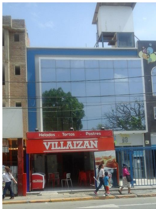
Figura 12. El lenguaje arquitectónico del Distrito de Chiclayo no está incorporando dispositivos de control solar externos (edificio en la calle San José, cuadra 3).