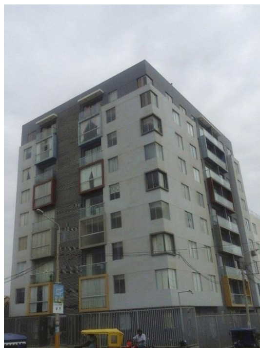
Figura 26. Las ventanas de estos edificios necesitan cortinas para que no entre el sol (edificio en Av. Salaverry, cuadra 9).