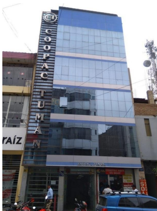
Figura 9. La ausencia de dispositivos de control solar externos no contribuye a la sostenibilidad de los edificios chiclayanos (edificio en calle Manuel María Izaga, cuadra 7).