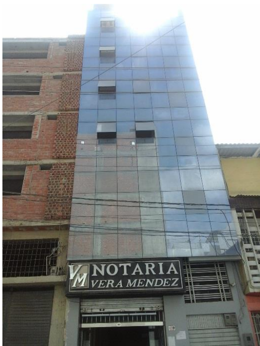
Figura 23. El reflejo del sol causa incomodidad entre los transeúntes (edificio en calle San José, cuadra 9).