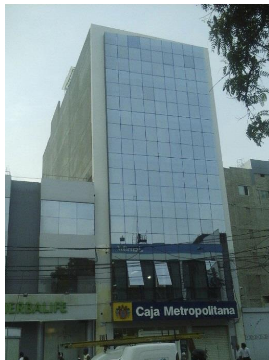
Figura 8. ¿Hay minimización de los gastos en climatización artificial en este tipo de edificios? ¿Qué pasa con el ahorro energético? (edificio en Av. Balta, cuadra 3).