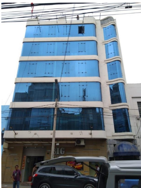
Figura 13. El uso de superficies vidriadas sin previo estudio bioclimático impide la construcción de un lenguaje arquitectónico regionalista (edificio en calle San José, cuadra 5).