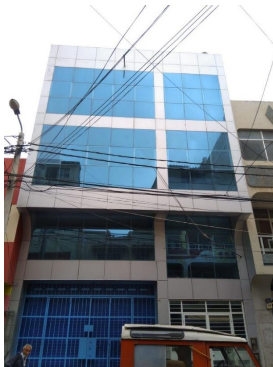
Figura 14. La inexistencia de dispositivos que produzcan sombra obstaculiza el desarrollo de un lenguaje arquitectónico regionalista (edificio en la calle Alfredo Lapoint, cuadra 12).