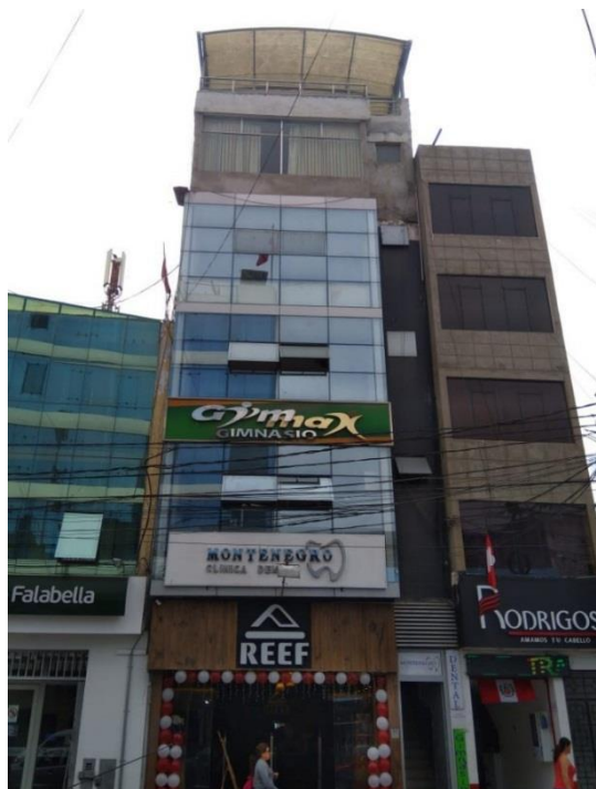
Figura 19. Estos edificios producen islas de calor (edificio en calle San José, cuadra 5).