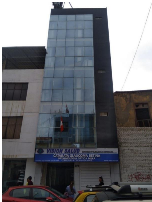
Figura 18. Las superficies vidriadas sin estudio bioclimático no transmiten el mensaje de respeto al ambiente (edificio en calle Manuel María Izaga, cuadra 5).