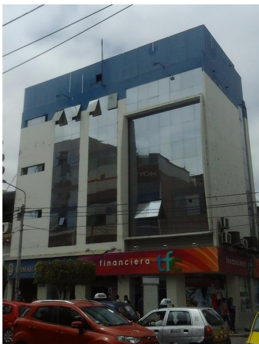
Figura 17. Estos edificios no contribuyen a la construcción de una identidad chiclayana (edificio en Av. Balta, cuadra 5).