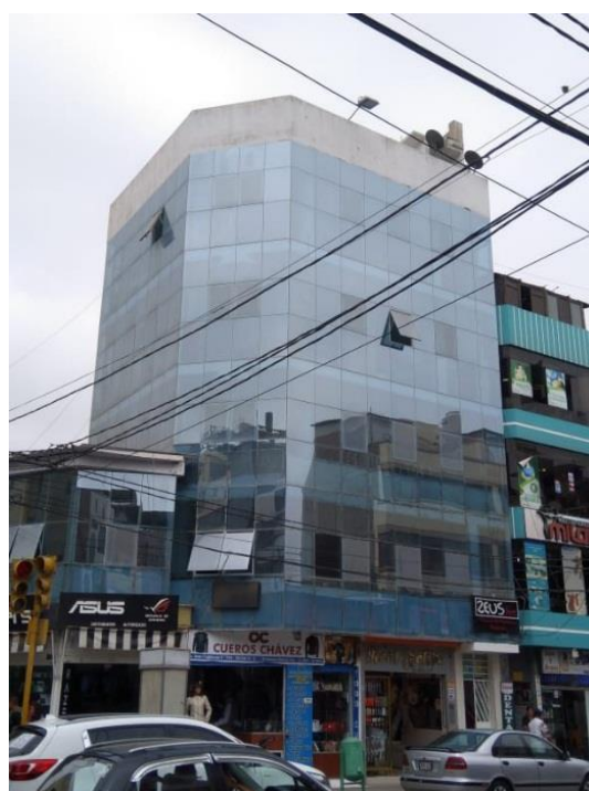
Figura 2. El significado de los dispositivos de control solar externos está ausente en el lenguaje arquitectónico del Distrito de Chiclayo debido a la carencia de un pensamiento crítico (edificio en calle San José, cuadra 5).