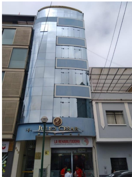
Figura 16. El equilibrio entre vanguardia y tradición no está presente en el lenguaje arquitectónico del Distrito de Chiclayo (edificio en calle Manuel María Izaga, cuadra 5).