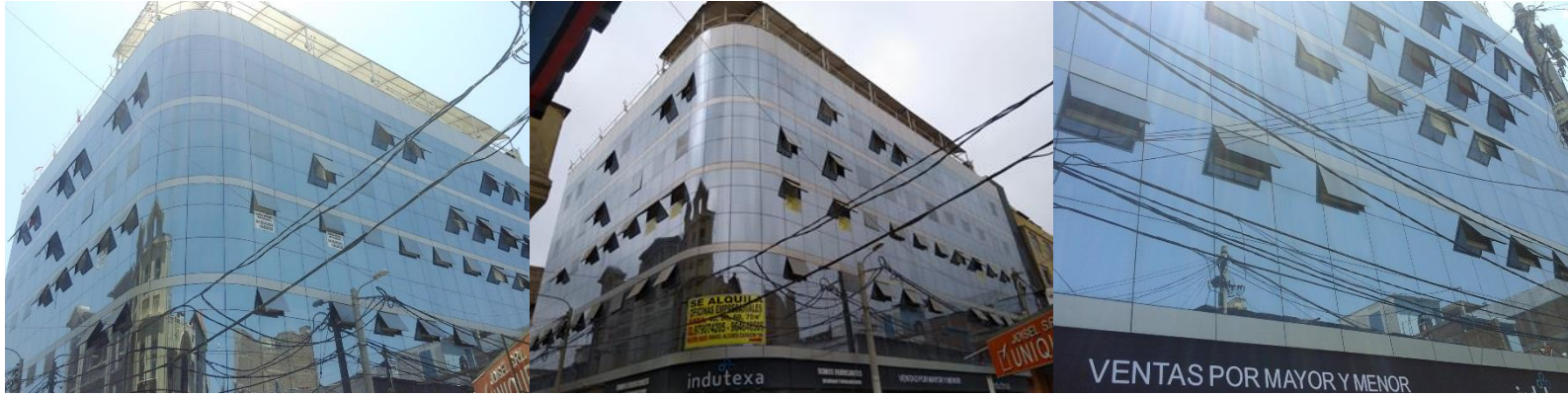
Edificio en la calle Elías Aguirre, cuadra 4