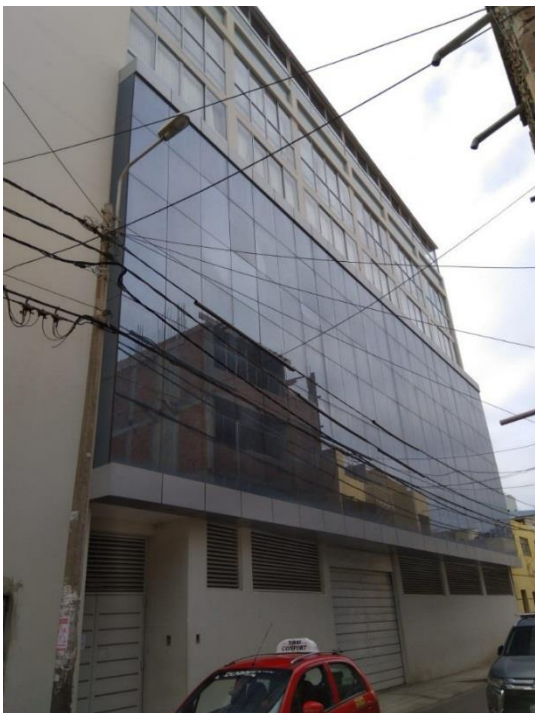
Figura 15. La tradición local ha desaparecido del lenguaje arquitectónico del Distrito de Chiclayo (edificio en calle Torres Paz, cuadra 4).