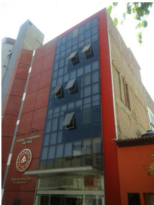
Figura 11. Los dispositivos de control solar externos no forman parte del imaginario colectivo de los habitantes del Distrito de Chiclayo (edificio en la calle Manuel María Izaga, cuadra 6).