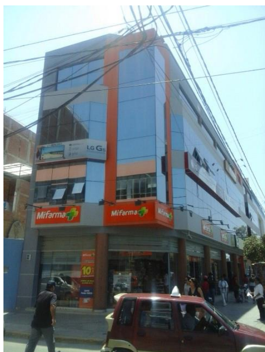
Figura 21. Estos edificios parecen 'cajas de cristal' (edificio en Av. Balta, cuadra 3).