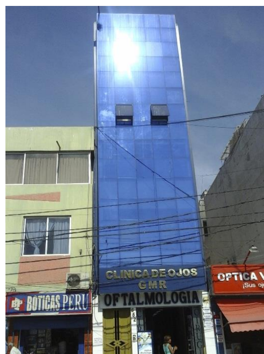
Figura 10. La carencia de dispositivos de control solar externos dificulta la construcción de un lenguaje arquitectónico regionalista en el Distrito de Chiclayo (edificio en calle Luis Gonzáles, cuadra 6).