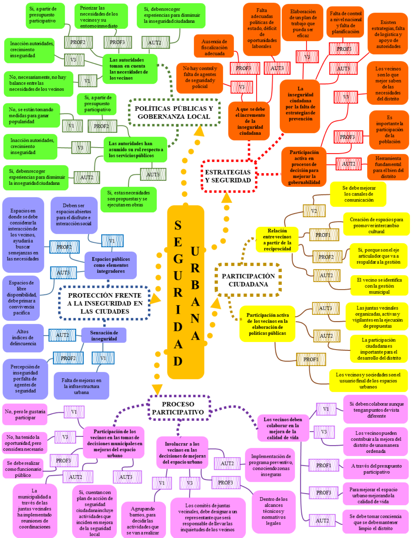
Figura N°1 Organizador de la fisonomía grupal (elaboración propia)