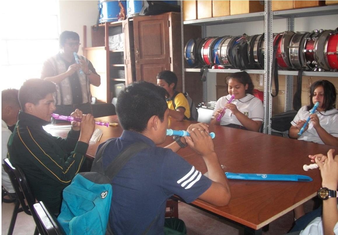
Fuente: Estudiantes y docente en sesiones de aprendizaje de ejecución de Flauta dulce