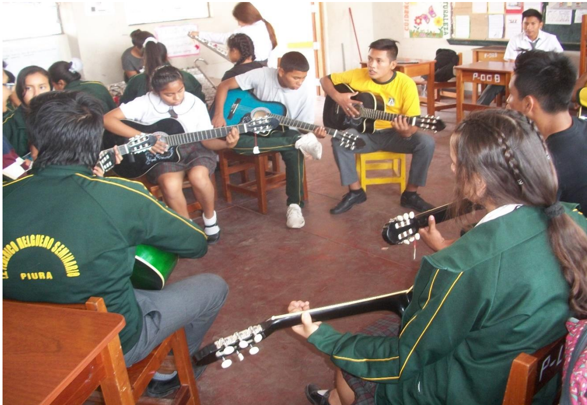
Fuente: Estudiantes en sesiones de aprendizaje de ejecución de la guitarra