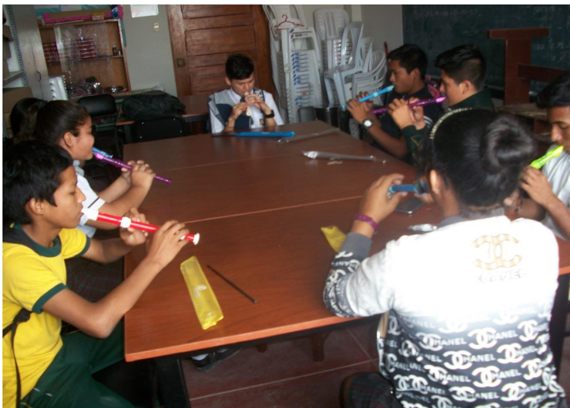
Fuente: Estudiantes en sesiones de aprendizaje de ejecución de Flauta dulce