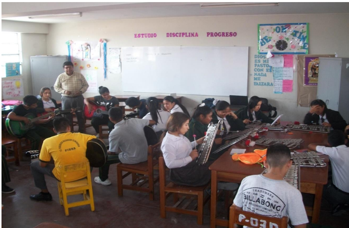
Fuente: Estudiantes en sesiones de aprendizaje de ejecución de la Guitarra y Lira