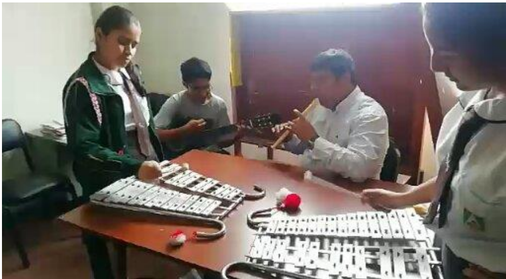
Fuente: Estudiantes en sesiones de aprendizaje de práctica de ejecución de canciones en Lira