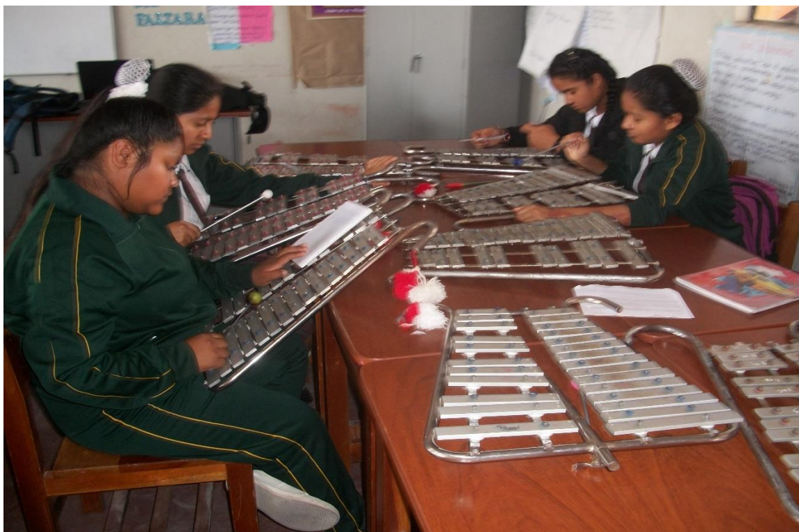
Fuente: Estudiantes en sesiones de aprendizaje de ejecución de Lira