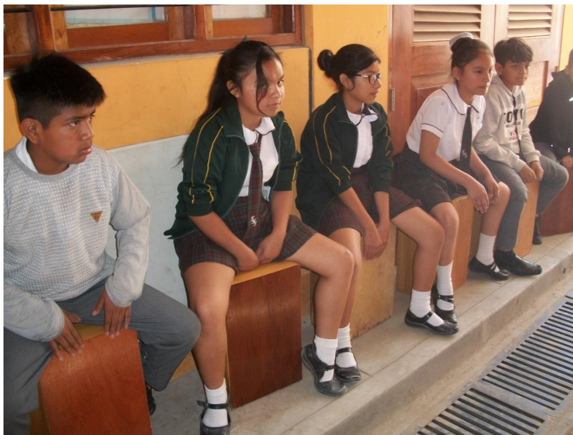
Fuente: Estudiantes participantes en sesiones de aprendizaje de ejecución de Cajón