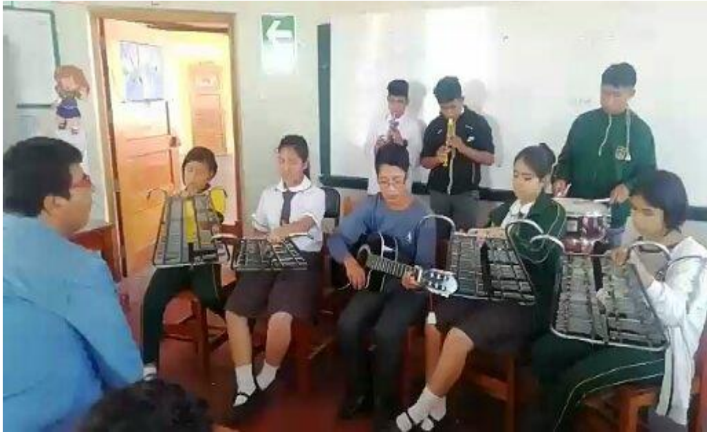
Fuente: Estudiantes en sesiones de aprendizaje de Práctica de ejecución instrumental