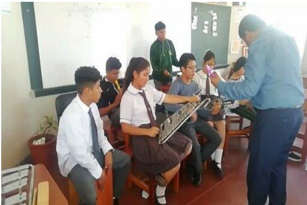
Fuente: Estudiantes realizando Prácticas de ejecución de Flauta dulce, cajón y guitarra