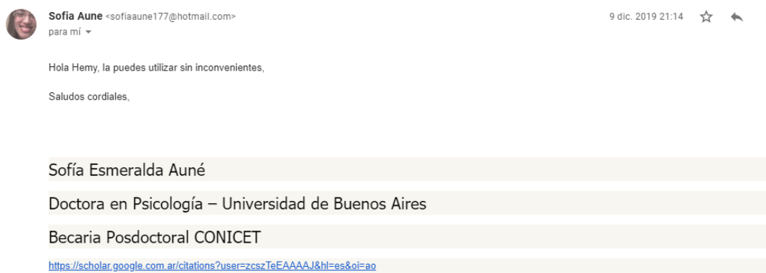
Figura 3: Autorización para uso de la Escala breve de Celos