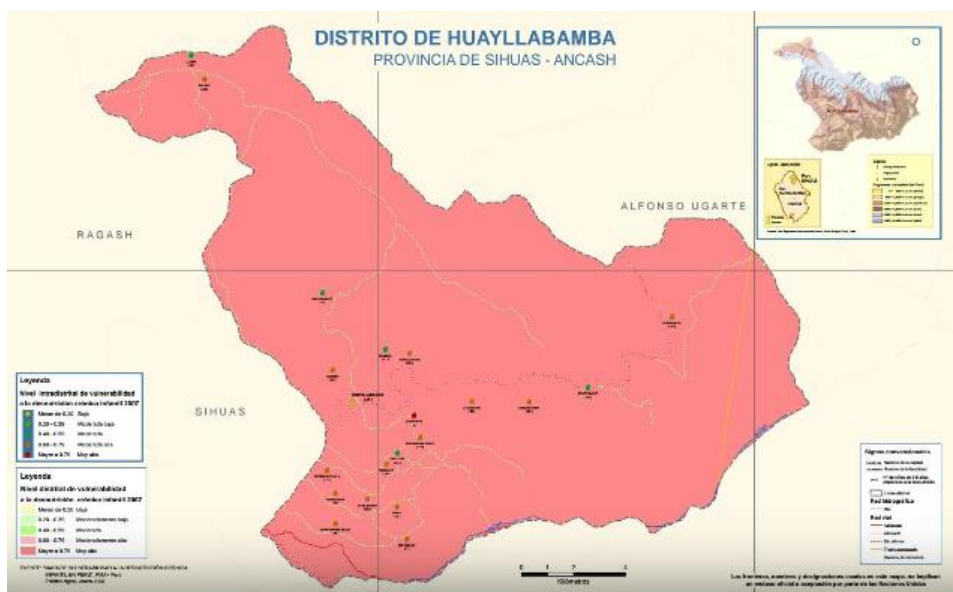
Figura 1. Mapa del distrito de Huayllabamba

El Marco espacial , el presente estudio investigativo se desarrollara en el distrito de Huayllabamba y pertenece a la provincia de Sihuas en Ancash, y es uno de los diez distritos que forman la provincia. Huayllabamba se creó el 26 de enero de 1956, tiene una extensión de 287,58 kilómetros cuadrados y una población aproximada de 4586 habitantes, su capital tiene el mismo nombre y se ubica a 3318 msnm.