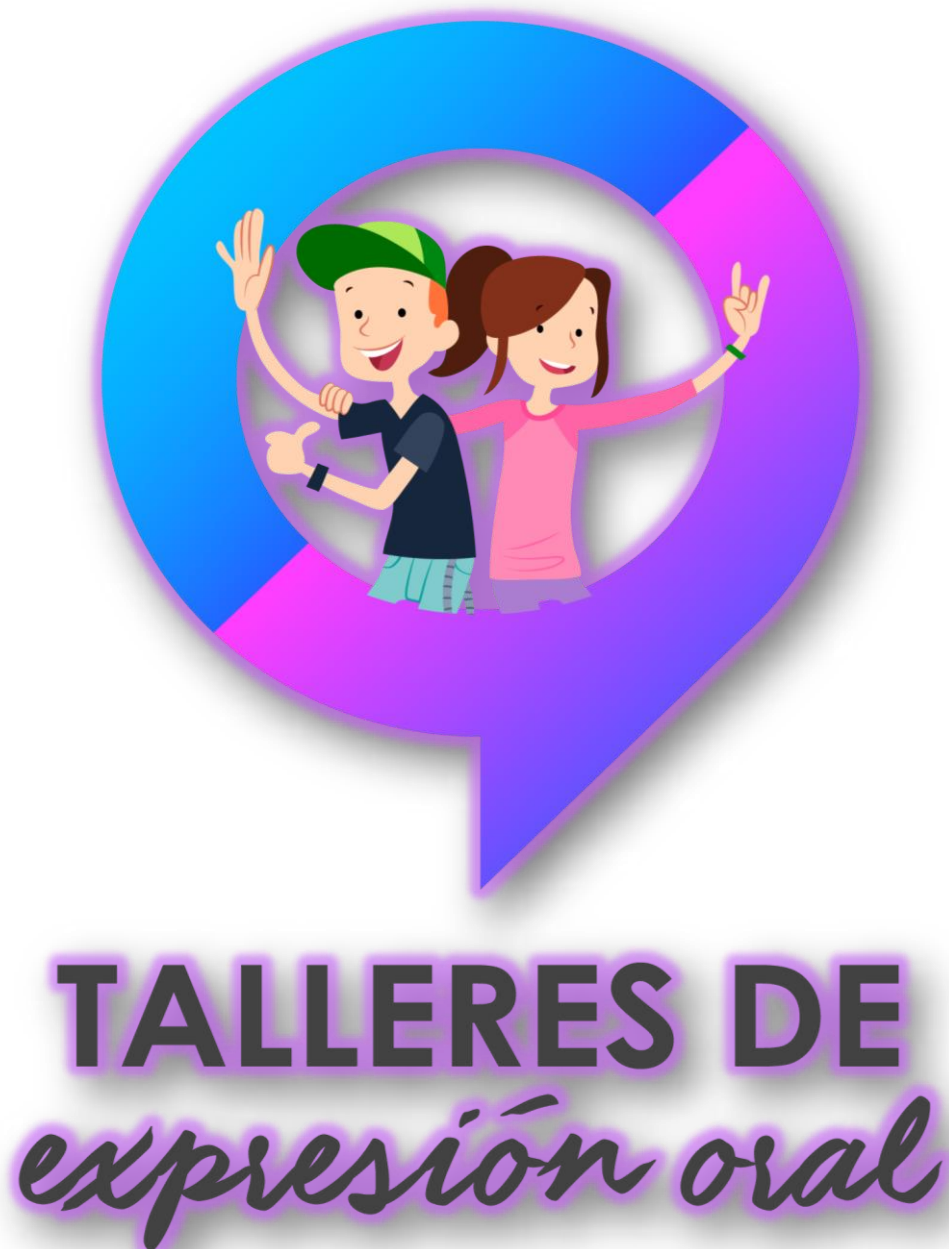
Figura 1 : Logo de los Talleres de expresión oral