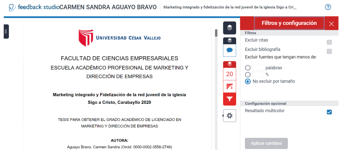
Figura 3 Reporte Turnitin