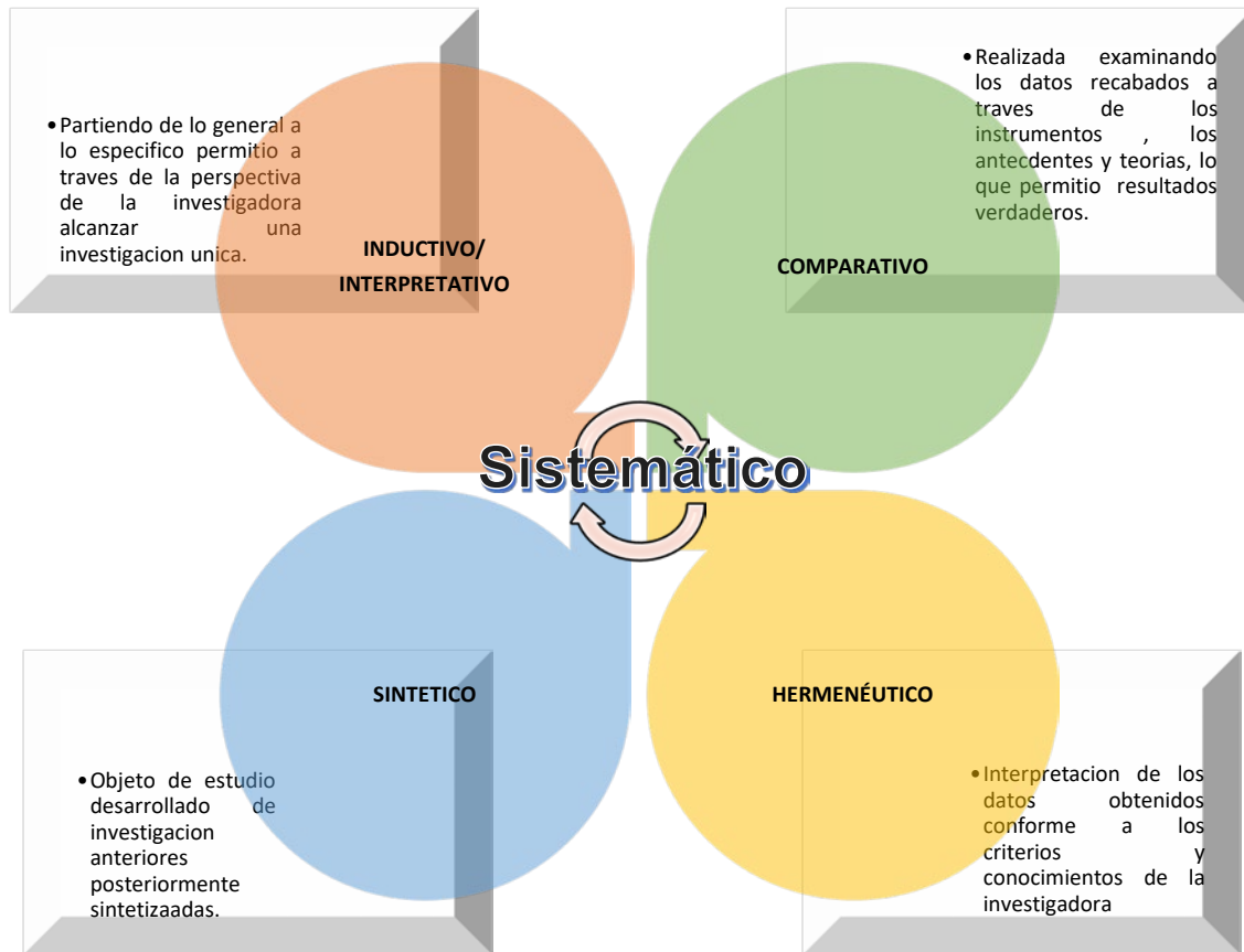
Figura 2. Métodos de análisis de la información