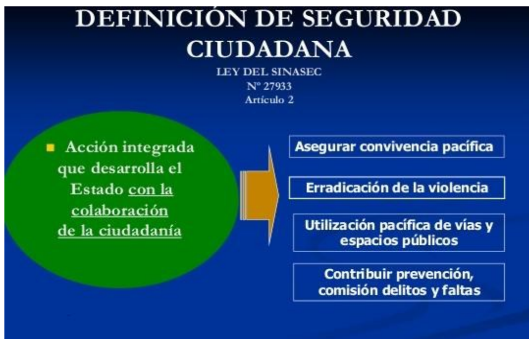
Figura 1. Definición de Seguridad Ciudadana

Plantea además la subordinación de la sociedad civil frente al Estado, cuya obligación es proporcionar la seguridad a la comunidad, sirviéndose de su “colaboración” o “contribución” para cumplir con este rol. La Policía Nacional promueve la organización de la comunidad en juntas vecinales de seguridad ciudadana con una concepción tutelar de las mismas, refiriéndose a ellas como las “Juntas Vecinales de la Policía” para el logro de estos objetivos. (Artículo 2)