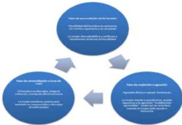
Figura 2 Ciclo de la violencia a la mujer según Walker