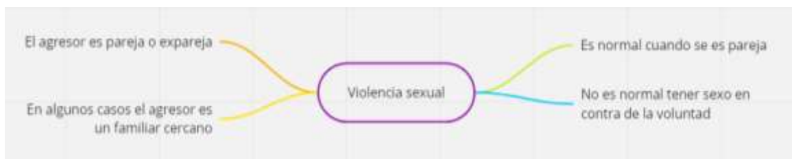
Figura 8 Categoría apriorística violencia sexual

La información proporcionada por las mujeres víctimas de violencia han podido hacer conocer que el agresor, que era su pareja sentimental, la realizaba mediante amenazas mediante llamadas telefónicas o mensaje de texto donde les decían que les pegarían y hasta las podrían llegar a matar, otra amenaza era el quitarle sus hijos. También surgía violencia por parte de la familia del agresor, con los que mantenía relación de familia, las víctimas acusaban a las víctimas de ser las provocadoras de la agresión; además, que no debían de continuar la denuncia por que el agresor era el padre de sus hijos y que como esposa debía de entender la agresión como parte de los problemas familiares, finalmente la ignoraban (figura 7).