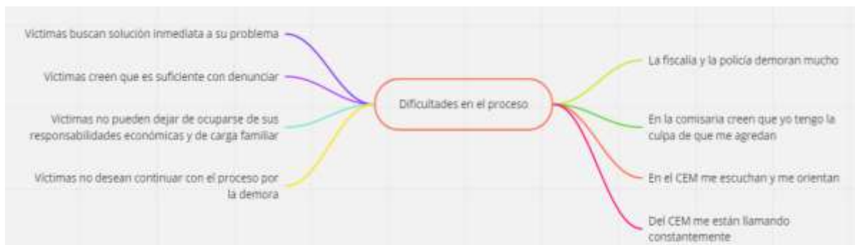
Figura 15 Subcategoría emergente dificultades en el proceso