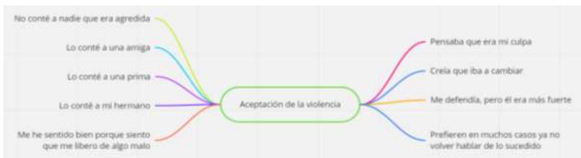
Figura 9 Subcategoría emergente aceptación de la violencia

En los casos de violencia sexual algunas de las víctimas entrevistadas han reconocido que la violencia sexual debe ser aceptada cuando la realiza su pareja, esta opinión fue reconocida como una actitud normal por una de las cinco entrevistadas, situación que llama la atención por demostrar que en estos casos la situación es grave para ella. La mayoría de las opiniones fueron negativas a la normalización de este tipo de agresiones contra ellas. Como característica principal se conoció que el agresor generalmente o en la mayoría de casos es su actual pareja o su anterior pareja, en casos menores y siendo la víctima una menor de edad su agresor fue generalmente una persona de su entorno familiar (figura 8).