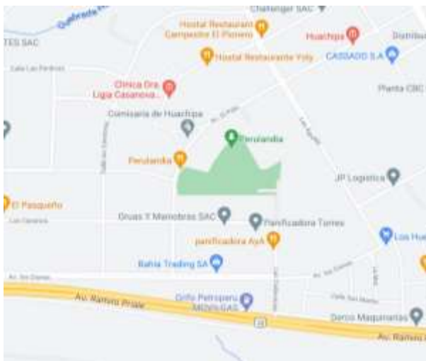
Figura 4 Ubicación del Centro de Emergencia Mujer de la Comisaria de Huachipa

El escenario de estudio fue el Centro de Emergencia Mujer de la Comisaria de Huachipa con dirección en Avenida El Polo s/n se ubica en el Centro Poblado Santa María de Huachipa, perteneciente al distrito de Lurigancho-Chosica. El Centro de Emergencia Mujer de la Comisaria Huachipa se encuentra a 11 kilómetros de la Plaza de Acho en el Cercado de Lima. Su extensión territorial es de 1,062.40 hectáreas, entre los valles de los rios Rimac y Huaycoloro, al este de la ciudad de Lima, su población aproximada es 20,347 habitantes (C.P. Santa María de Huachipa, 2017).