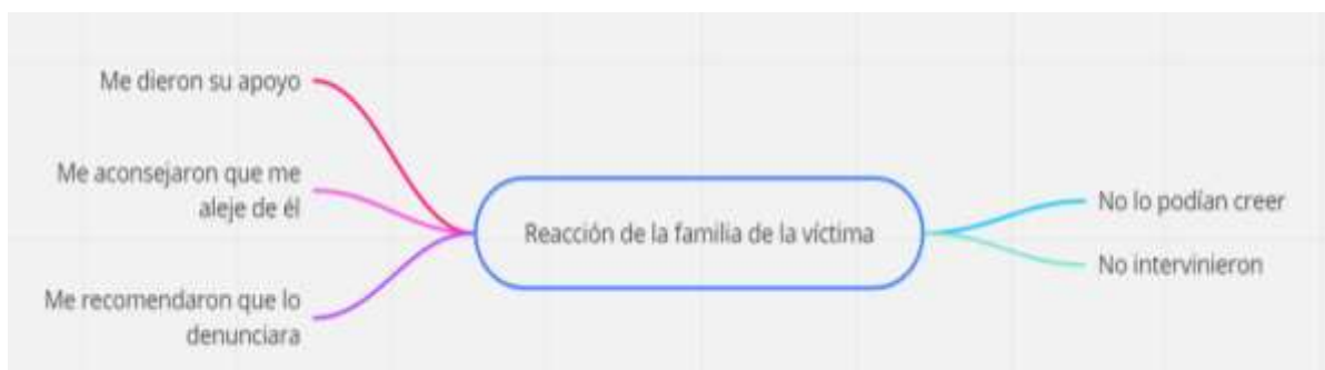
Figura 10 Subcategoría emergente reacción de la familia de la víctima

Dentro de los hallazgos obtenidos en la entrevista la aceptación de la violencia por parte de las víctimas tiene como principales características que generalmente no se cuenta a nadie de las agresiones padecidas dentro del hogar por la pareja, algunas víctimas se lo contaron a una amiga, a una prima o a un hermano, esto sucede porque las víctimas tienen algún sentido de culpabilidad en la agresión recibida, otra respuesta señala que lo aceptaba porque creía que su agresor cambiaría con el transcurrir del tiempo, una minoría se defendía pero no podía soportar mucho ante la fortaleza de su agresor, la mayoría prefiere no volver a hablar de los hechos. En minoría, alguna víctima manifestó que se sintió bien porque sintió haberse liberado de una carga negativa (figura 9).