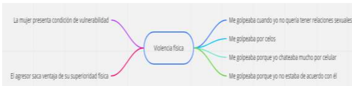
Figura 6 Categoría apriorística violencia física