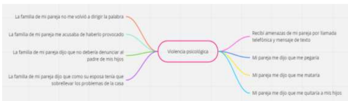
Figura 7 Categoría apriorística violencia psicológica

Lo que han señalado las informantes hacen conocer que la violencia física infringida sobre ellas ha tenido como principales características las causa de la agresión a la no aceptación a tener relaciones sexuales con el agresor, en este caso la conducta del agresor responde a la de un individuo machista que considera a la mujer como parte de su propiedad y que debe estar sumisa a sus requerimientos de intimidad; otra característica de este tipo de agresiones corresponde a la que el agresor justificaba la misma por los celos que sentía de su pareja a la que necesitaba demostrar que a él se le debía respeto y fidelidad; otra característica era la justificación del agresor a la conducta amigable de su pareja al mantener prolongadas conversaciones telefónicas, en la que el agresor quiere demostrar su posición de dominante en la relación; en el caso de que el agresor golpeaba a la víctima por no encontrarse de acuerdo con las decisiones de este responde a imponer su posición de dominante en la relación. En todos estos casos se presenta a la mujer en la condición de vulnerabilidad porque su agresor aprovecha de su posición física superior frente al de la mujer víctima de su violencia (figura 6).