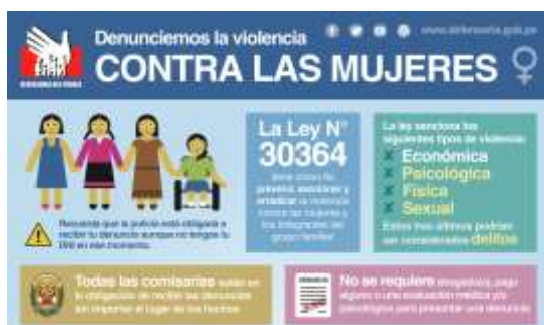
Figura 3 Estrategia comunicacional de la Defensoría del Pueblo

Como una medida que permita concientizar a la sociedad, las instituciones responsables de han creado una estrategia comunicacional para su fortalecimiento