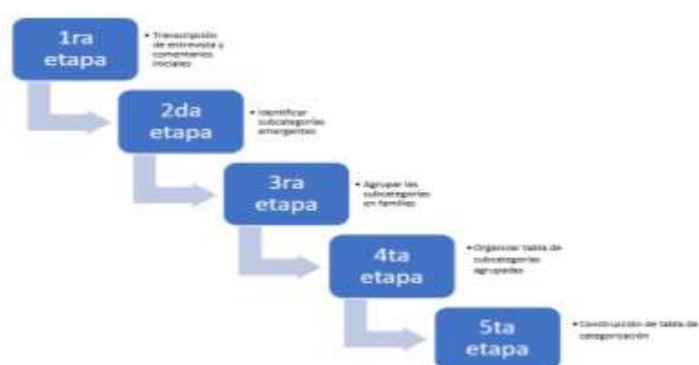
Figura 5 Análisis fenomenológico interpretativo

El análisis de los datos obtenidos mediante la entrevista semiestructurada fue la técnica del análisis fenomenológico interpretativo con modificación a la realidad nacional. dividiendo el análisis en etapas iniciando con la transcripción de las entrevistas y la elaboración de los comentarios iniciales, segunda etapa la identificación de las subcategorías emergentes, tercera etapa agrupar las subcategorías identificadas en familias, cuarta etapa se organiza una tabla de las subcategorías agrupadas; en la quinta etapa se construyen las tablas de categorización y finalmente se redactan los resultados (Duque & Aristizábal, 2019).