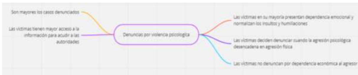
Figura 13 Subcategoría emergente denuncias por violencia psicológica