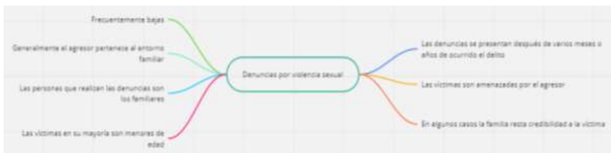
Figura 14 Subcategoría emergente denuncias por violencia sexual

En los casos de denuncias por violencia psicológica su principal característica fue que de manijestaron en mayor cantidad que los de violencia física y sexual, en la violencia psicológica las víctimas han presentado dependencia emocional normalizando los insultos y humillaciones sucedidos contra su persona, que no denuncian porque son apoyadas económicamente de forma directa por sus agresores y que denuncian solo cuando la violencia psicológica se incrementa hasta llegar a la agresión física. En la actualidad, la difusión de la información referente a denunciar los casos de violencia llegan con mayor facilidad a la ciudadanía (figura 13).