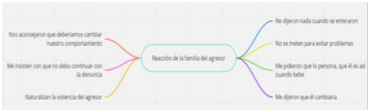
Figura 11 Subcategoría emergente reacción de la familia del agresor

y agresor) su comportamiento, con lo que tacitamente están culpabilizando a ambos de los hechos de violencia (figura 11).