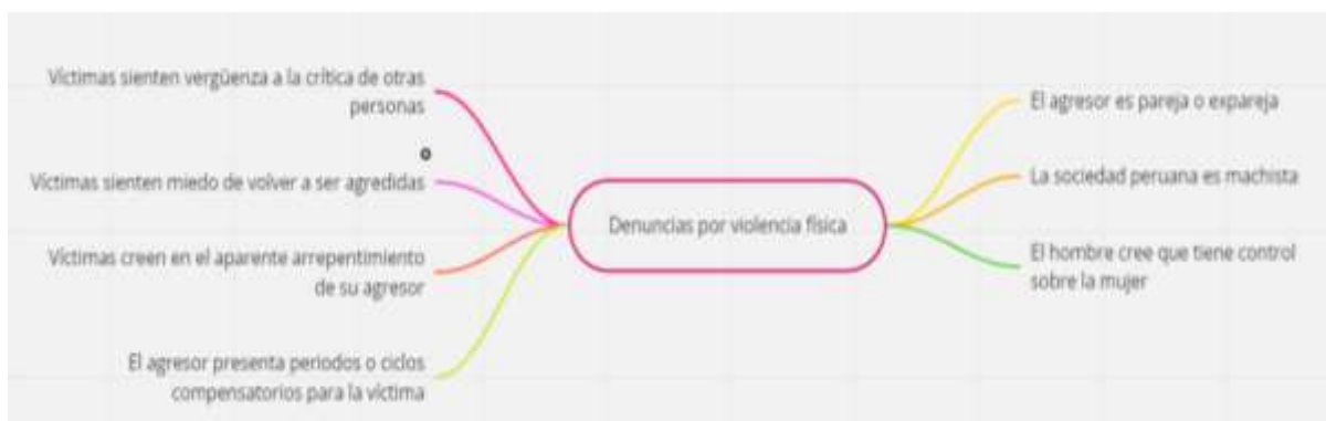
Figura 12 Subcategoría emergente denuncias por violencia física

En los hallazgos que emergen de las entrevistas realizadas a víctimas y especialistas del Centro de Emergencia Mujer, se ha podido conocer que para los casos de las denuncias por violencia física generalmente el agresor es la pareja actual o la expareja y que esto se puede entender por la naturaleza machista de la sociedad, los agresores creen tener el control de la vida de su víctima, después de lo sucedido el agresor presenta comportamientos compensatorios de forma periódica hasta que vuelve a su actitud violenta. Por otra parte, las víctimas sienten vergüenza de la crítica de algunas personas de su comunidad, también demuestran temores a ser nuevamente agredidas por su pareja y otras creen en el supuesto arrepentimiento de quien las agredió (figura 12).