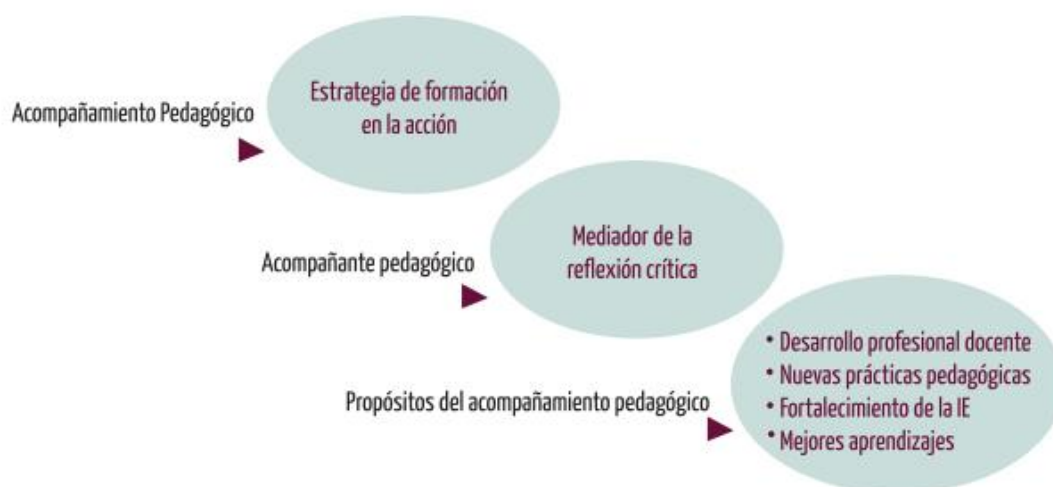
Figura 01. Acompañamiento pedagógico

proceso de acompañamiento permitirá obtener un cambio de actitud en los profesores (Ventura, 2008 citado por Yana Salluca y Adco Valeriano, 2018).