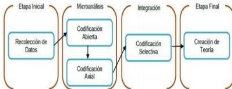
Figura 1: Procesos de la TEORÍA FUNDAMENTADA .