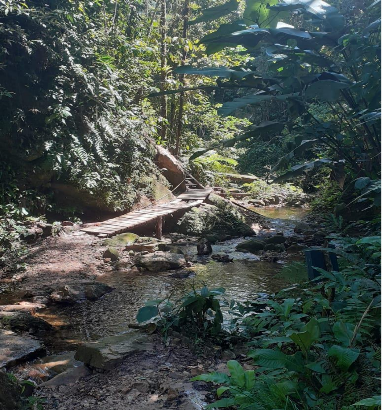
Recorrido al recurso Cascada Salto de la Bruja