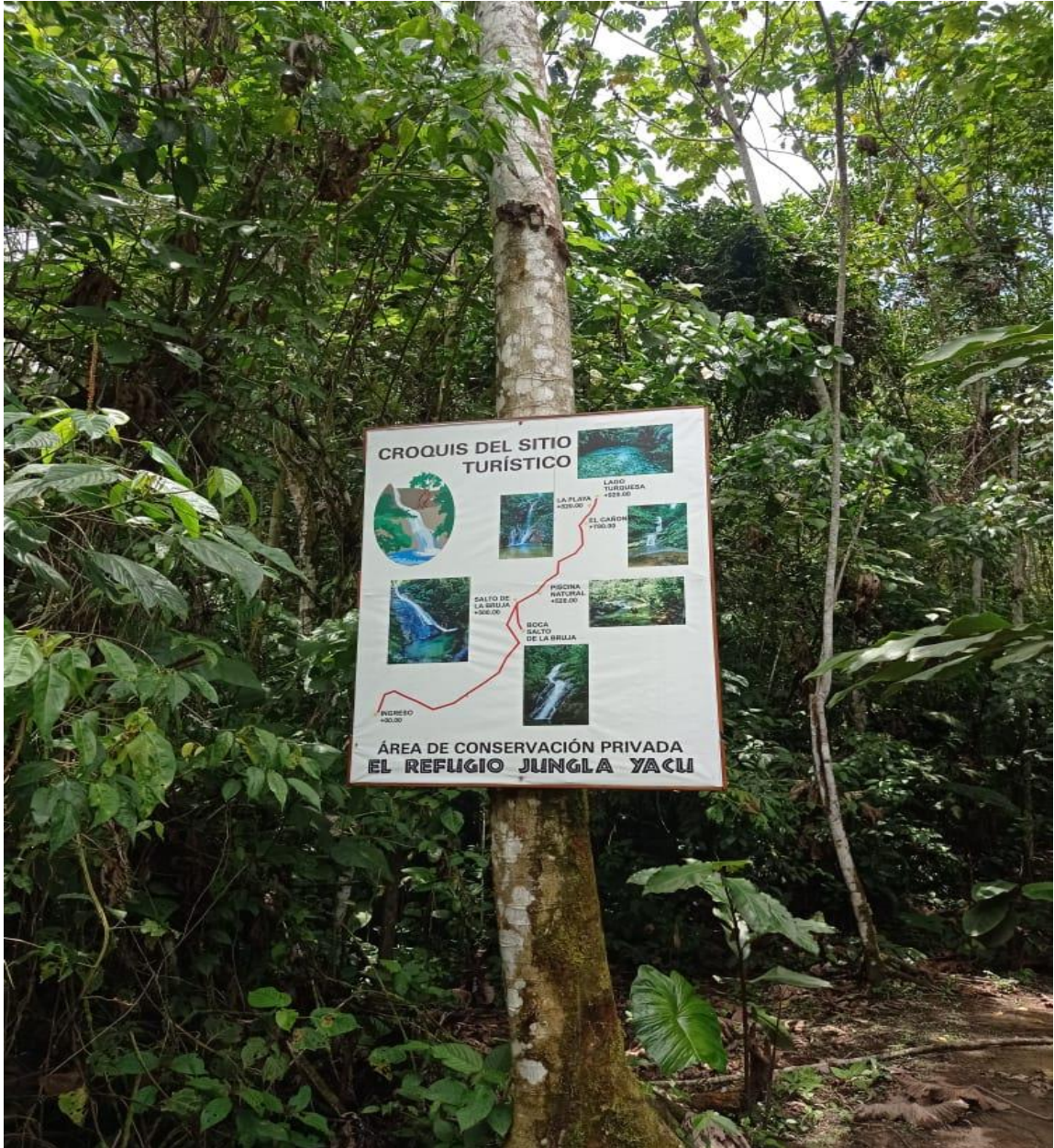
Croquis del recurso del recurso Cascada Salto de la Bruja