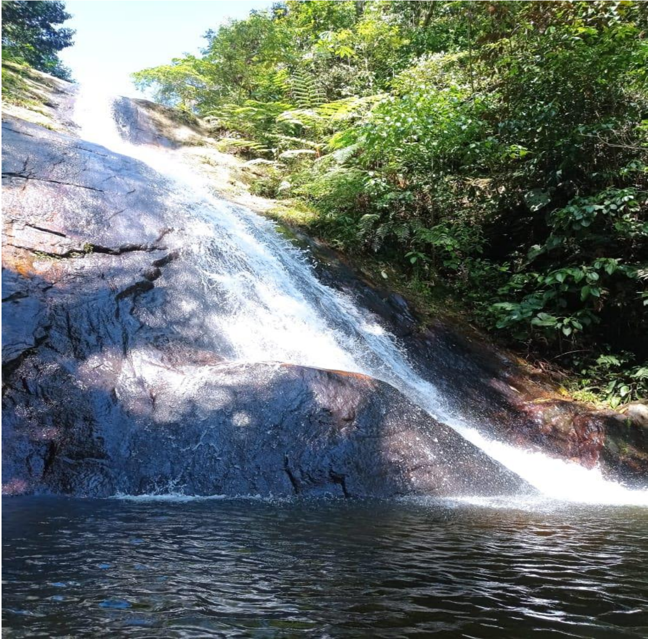
Cascada Salto de la Bruja