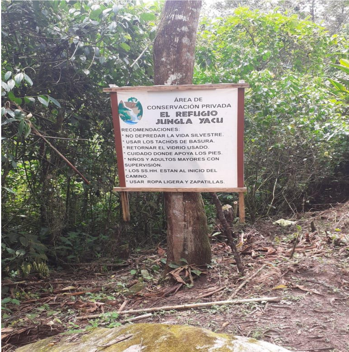
Panel de informacion