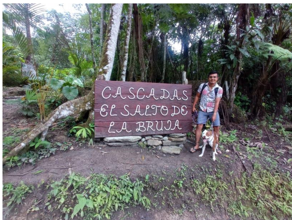
Entrada al recurso turístico Cascada Salto de la Bruja