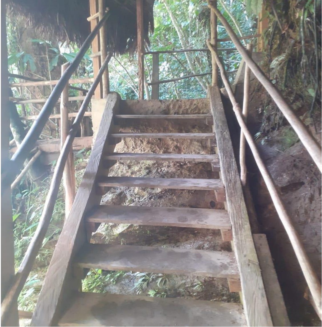
Llegada al Recurso Cascada Salto de la Bruja