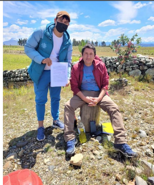
FOTOGRAFÍA 4: Emprendedor Turístico y Regidor de la Municipalidad de Cátac