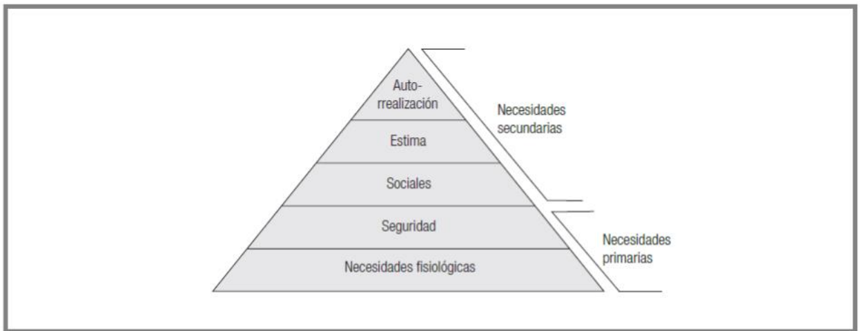
Figura 3. Jerarquía de las necesidades humanas según Maslow.

Para Maslow, las personas tendrán la posibilidad de satisfacer aquellas necesidades según sea su relevancia o importancia, es por ello por lo que propone una lista de cinco necesidades. La teoría se basa en la jerarquía de las necesidades humanas dividiéndolos en necesidades primarias y secundarias estando en la cúspide aquellas necesidades más predominantes y en la base las más bajas y recurrentes.