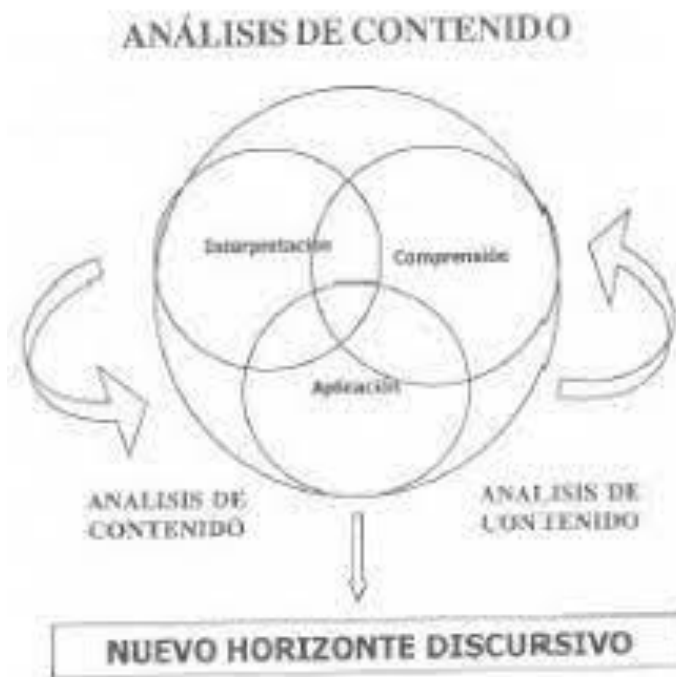
Figura 2: Método Hermenéutico

Gadamer (2012), siendo el máximo representante y padre de la hermenéutica, considerada como el arte de poder interpretar los fenómenos, se apoya sobre la base de que el investigador debe conocer el contexto, debido a que al no estar dentro del contexto puede alterar la interpretación, mientras que, si el investigador se encuentra o es parte del contexto podrá entender y comprender mejor el fenómeno que está ocurriendo y podrá brindar un mejor análisis. Orientado a la comprensión y entendimiento que queda después de todo lo argumentado, por lo que busca como finalidad el establecer un acuerdo, empleando la comprensión, interpretación y aplicación.