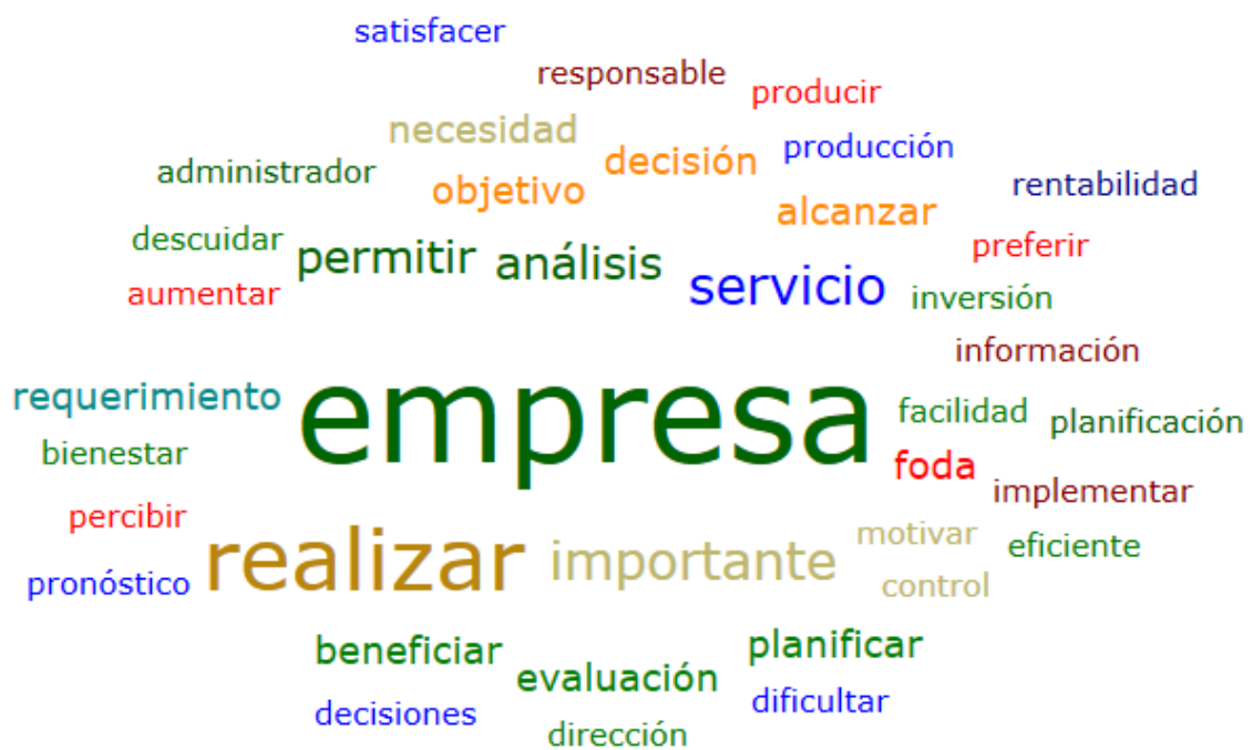
Nube de palabras de la entrevista al colaborador 1 de toma de decisiones

empresa realizar importante servicio análisis permitir alcanzar beneficiar decisión evaluación foda necesidad objetivo planificar requerimiento administrador aumentar bienestar control decisiones descuidar dificultar dirección eficiente facilidad implementar información inversión motivar percibir planificación preferir producción producir pronóstico rentabilidad responsable satisfacer