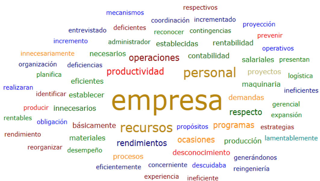
Nube de palabras de la entrevista al colaborador 1 de contabilidad gerencial