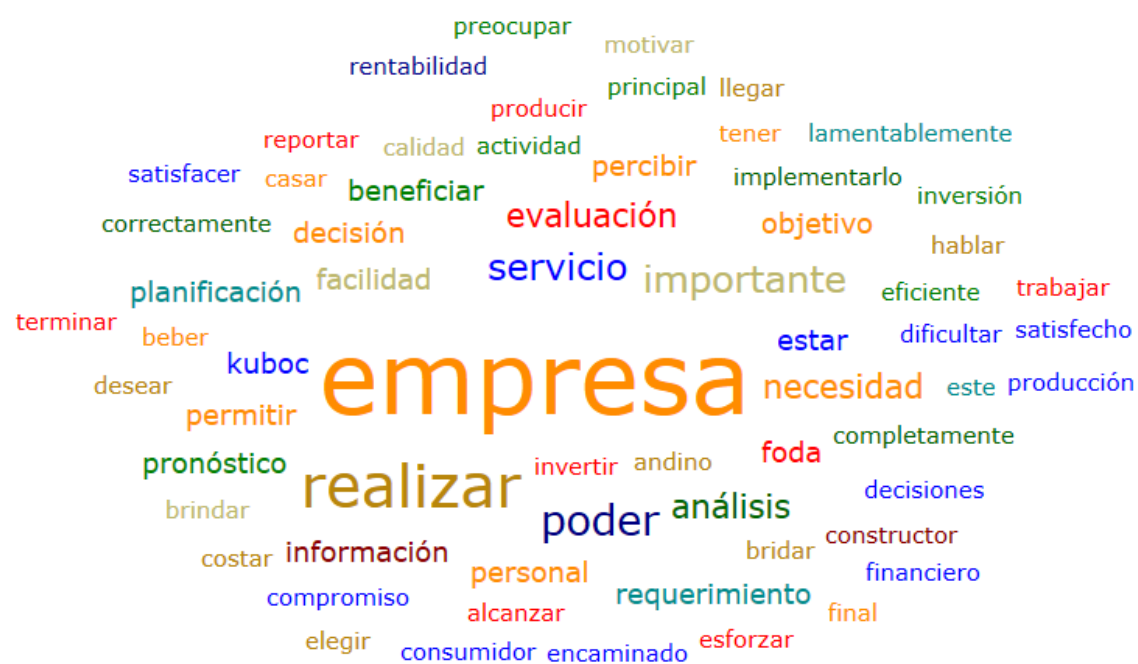
Nube de palabras de la entrevista al colaborador 2 de toma de decisiones

empresa realizar poder importante servicio análisis evaluación necesidad beneficiar decisión estar facilidad foda información kuboc objetivo percibir permitir personal planificación pronóstico requerimiento actividad alcanzar andino beber bridar brindar calidad casar completamente compromiso constructor consumidor correctamente costar decisiones desear dificultar eficiente elegir encaminado esforzar este final financiero hablar implementarlo inversión invertir lamentablemente llegar motivar preocupar principal producción producir rentabilidad reportar satisfacer satisfecho tener terminar trabajar