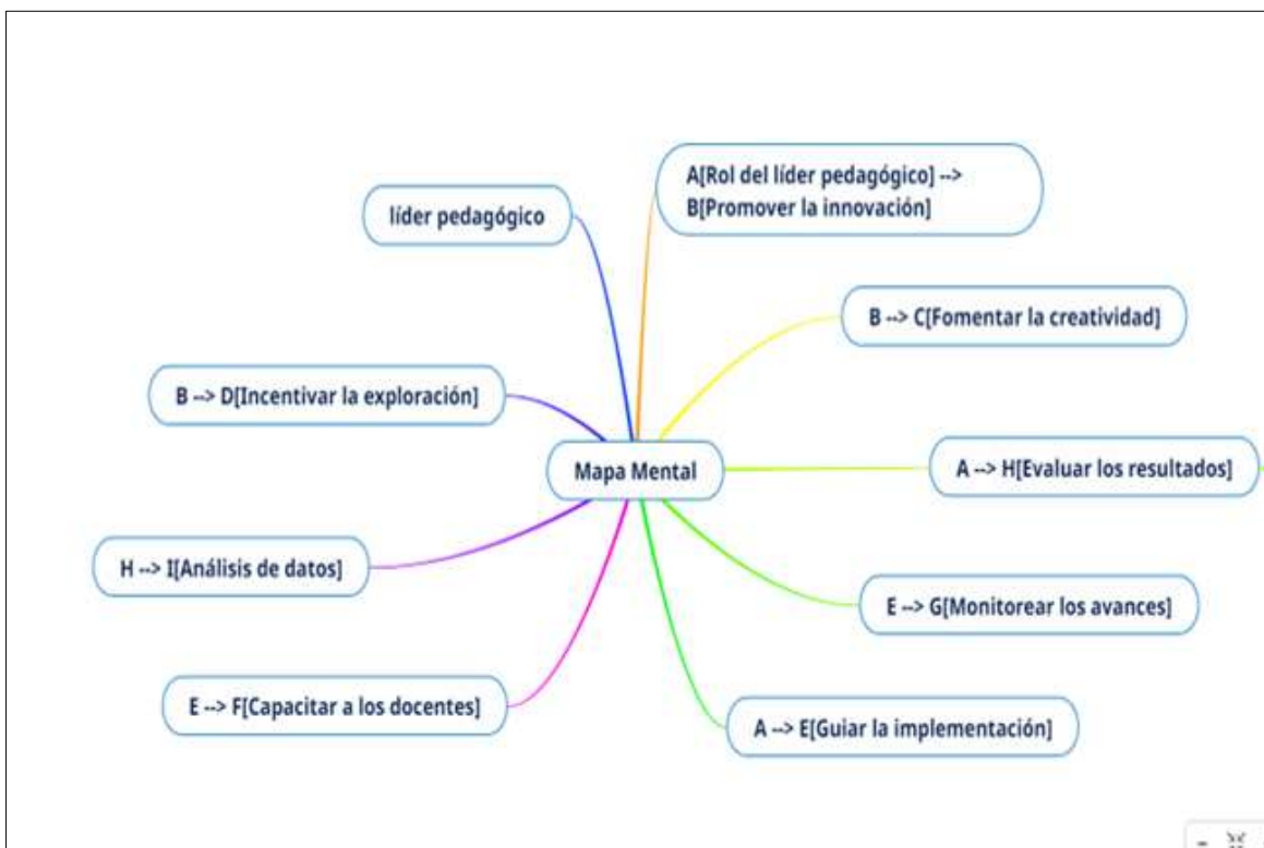
Gráfico N° 5 Habilidades del Líder Pedagógico

valoración de diferentes enfoques. Por otra parte, las diferencias identificadas se centran en el énfasis práctico y específico que los informantes aportan a la discusión sobre el liderazgo pedagógico. En lugar de limitarse a conceptos teóricos, los informantes enriquecen la conversación al ofrecer ejemplos concretos de cómo aplicar la inteligencia emocional en situaciones específicas, como identificar emociones, brindar apoyo motivacional y fomentar el trabajo colaborativo. Además, su énfasis en la creación de espacios seguros y actividades para cultivar la empatía añade una dimensión práctica significativa a la conversación. Esta orientación práctica no solo respalda las recomendaciones teóricas, sino que también proporciona estrategias tangibles y aplicables que enriquecen la comprensión del liderazgo pedagógico pospandemia. En resumen, la intersección entre la teoría y la práctica, como revelada por las experiencias de los informantes, ofrece un enfoque completo y aplicado para abordar los desafíos educativos actuales.