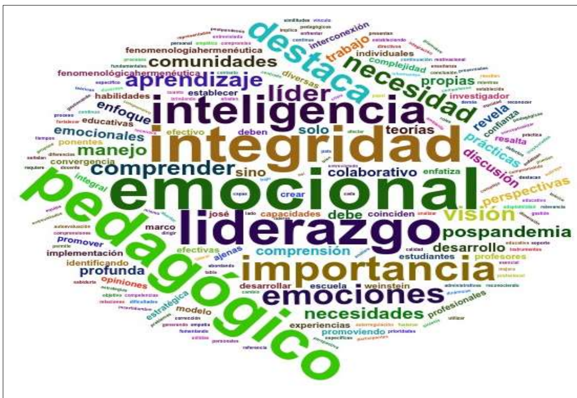
Gráfico N° 4: Bienestar emocional