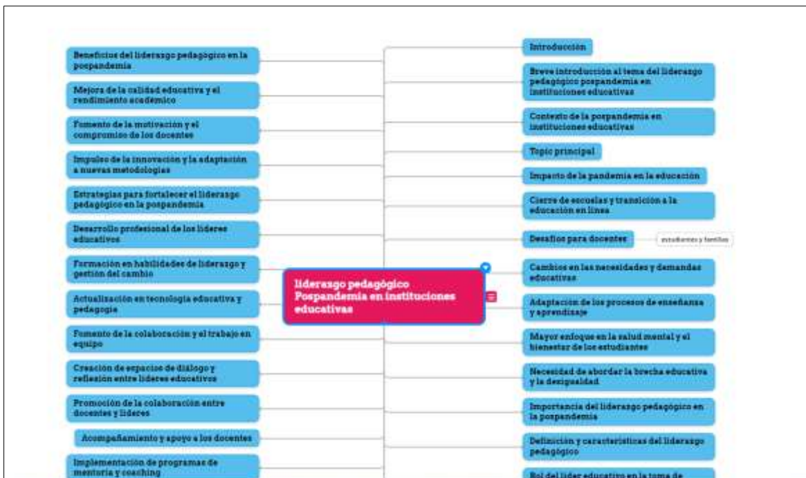
Gráfico N° 2: El líder pedagógico y sus roles determinados