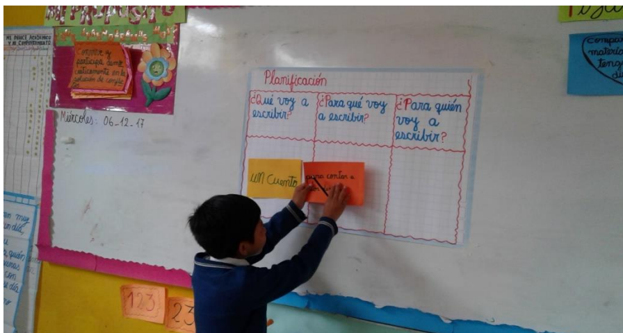
Proceso de planificación