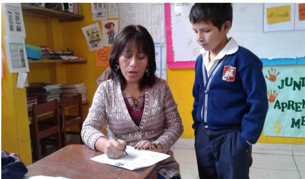
Recomendando para producir textos narrativos