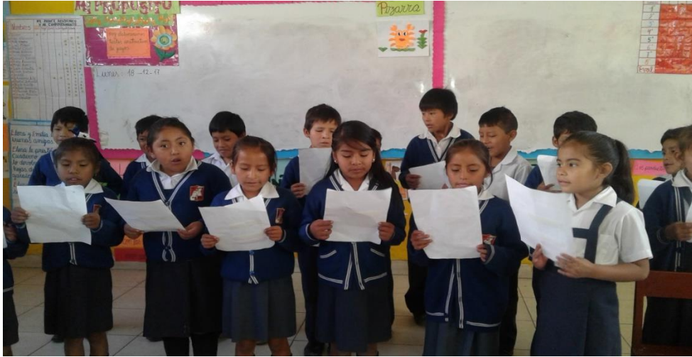
Compartiendo la oralitura de Huanta