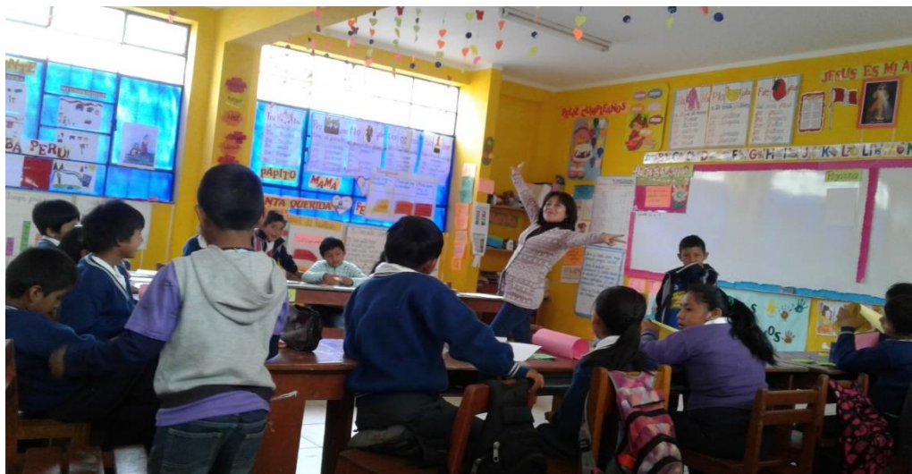
Investigadora trabajando con los estudiantes