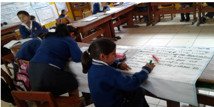
Proceso de textualización