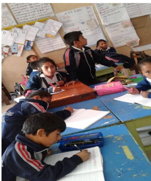
Revisando los textos escritos