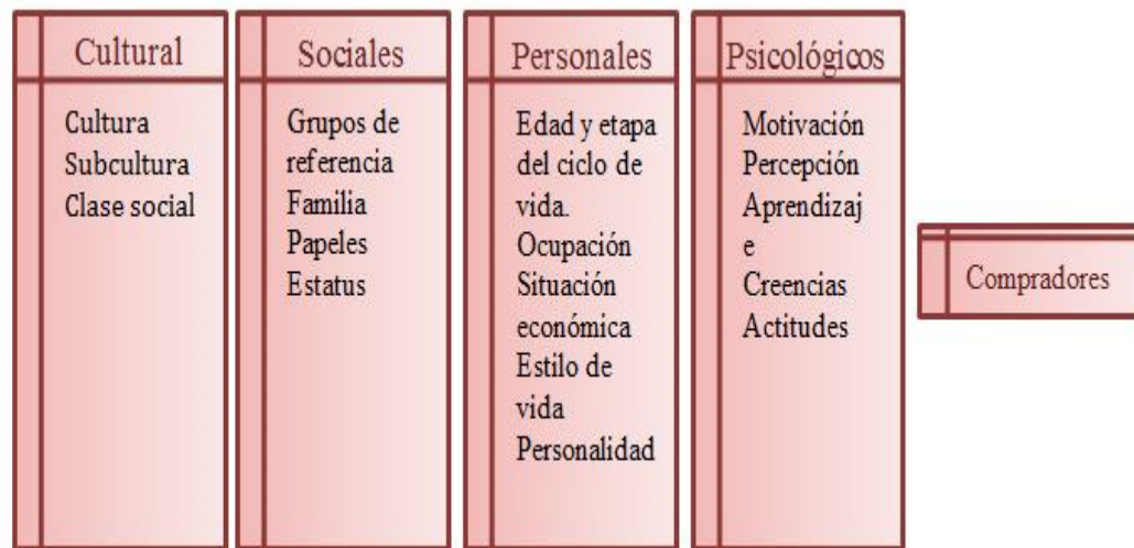
Figura 3: Factores de Conducta de Compra del Consumidor

adquirir bienes de acuerdo a la etapa de su desarrollo, y estos van cambiando pues sus necesidades mutan en base a sus características de su desarrollo tanto biológico como psicológico o social.