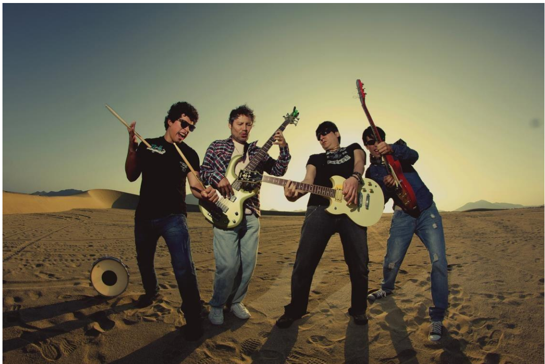
(En la foto, Polvo Libre)