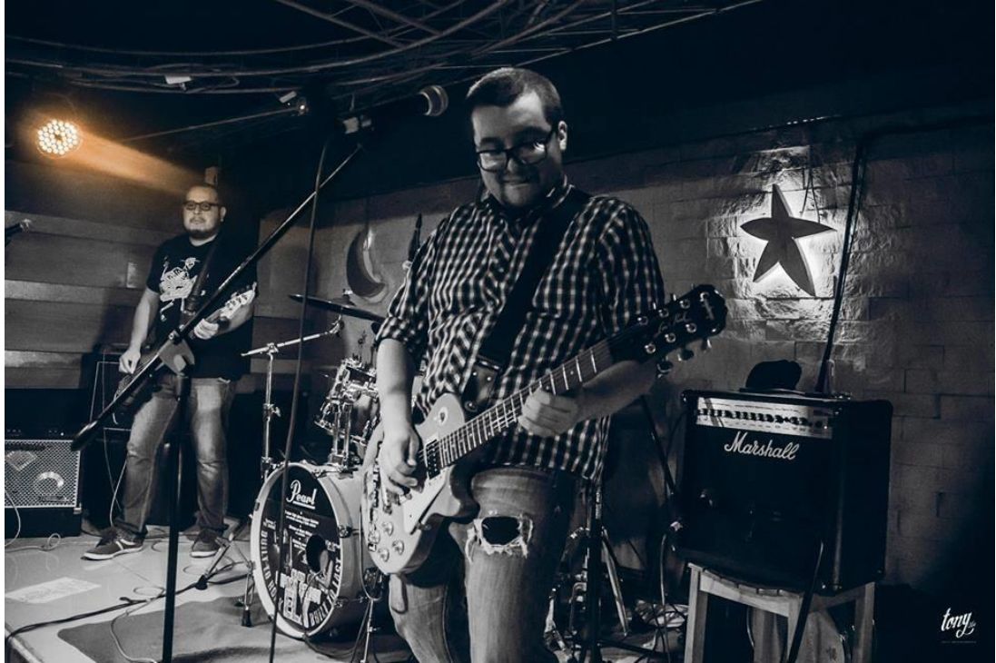
(En la foto, Andariel)