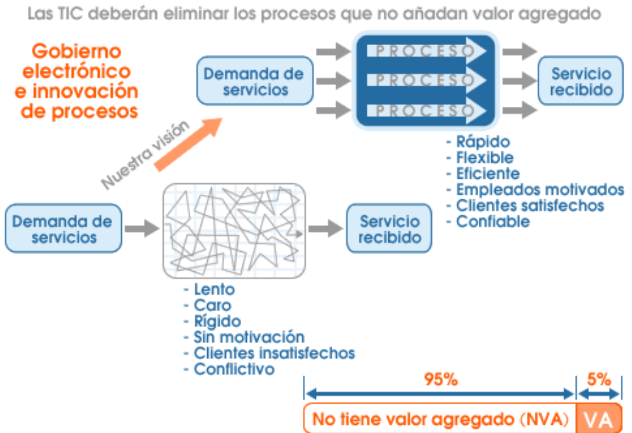
Lustración 2: Modelo estratégico de Innovación.

Anexo 3 El siguiente esquema se visualiza las fases del gobierno electrónico en México y los procesos de innovación.