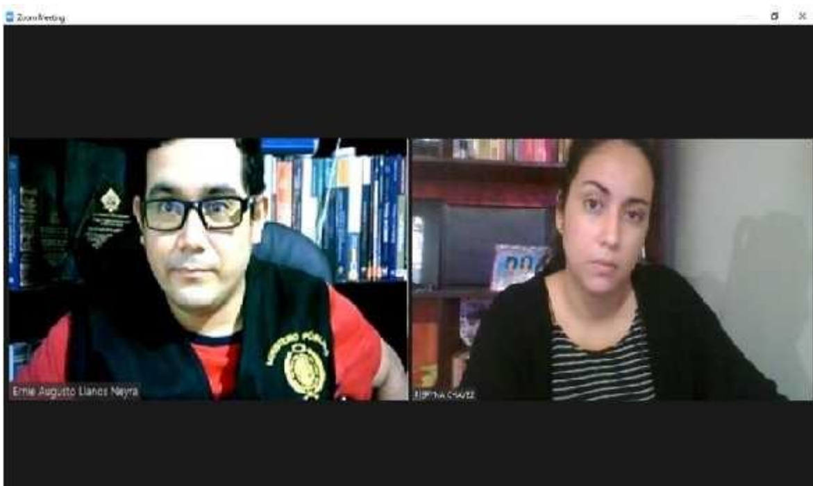
Ilustración 11 Evidencias de las entrevistas.