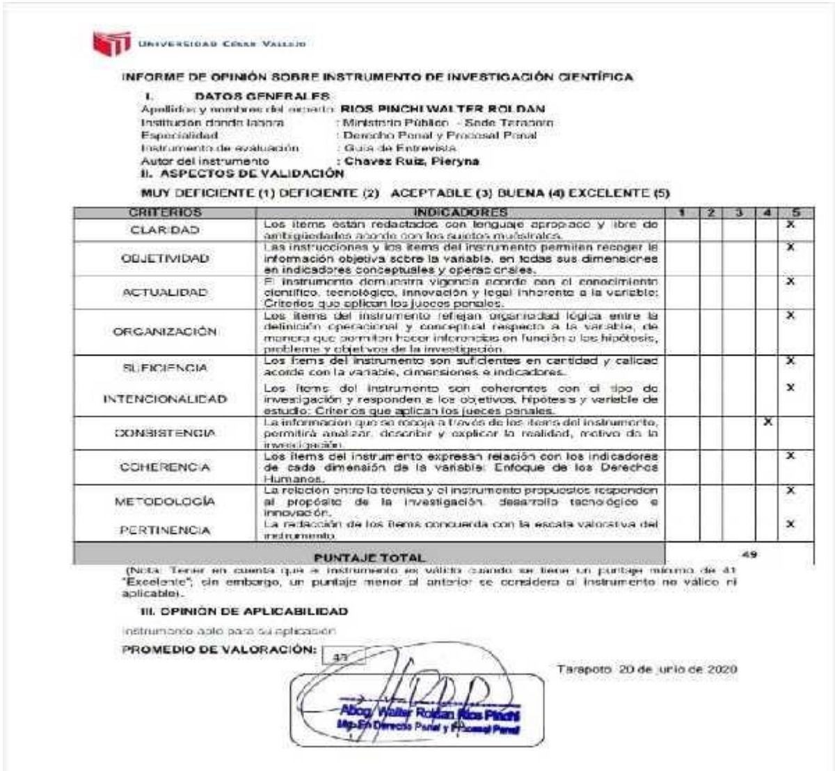
Ilustración 7 Informe de Opinión sobre instrumento de investigación científica III.