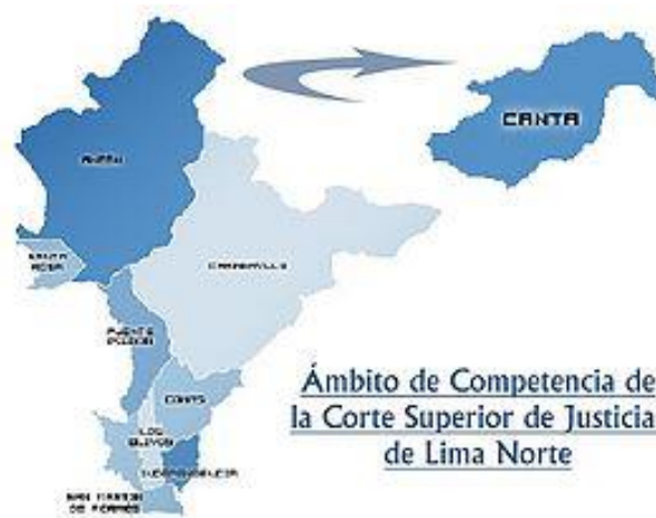
Figura 1 Mapa Geográfica Distrito Judicial de Lima Norte