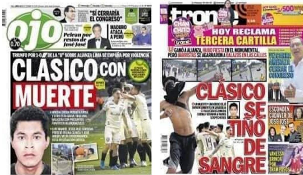
Tabla 3. Ficha de observación – aspecto No lingüístico

A continuación, se puede observar las portadas de los diarios Trome y Ojo para el siguiente análisis.