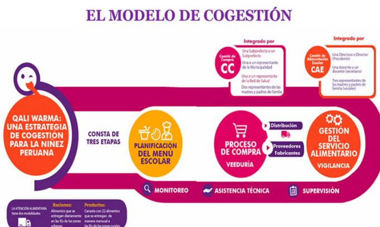
gráfico 1: modelo de cogestión

“Garantizar el servicio alimentario durante todos los días del año escolar a los usuarios del Programa de acuerdo a sus características y las zonas donde viven; Contribuir a mejorar la atención de los usuarios del Programa en clases, favoreciendo su asistencia y permanencia; Promover mejores hábitos de alimentación en los usuarios del Programa. A través de la cogestión con la comunidad educativa a quien le brinda herramientas y capacidades. (QALI WARMA, 2020, P 1).