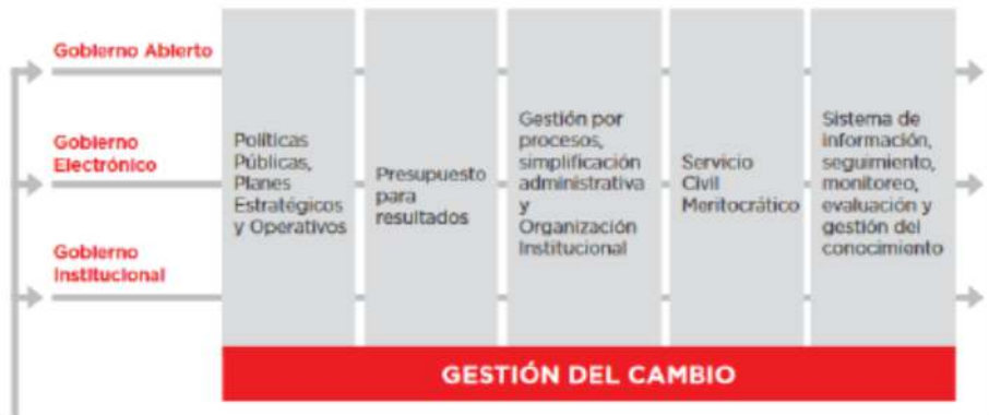
Figura 2: Plan de Gobierno Digital 2020-2022 Osinergmin

el usuario. La Interoperabilidad técnica contribuye con analizar los asuntos tecnológicos (hardware, software, telecomunicaciones), imprescindibles para vincular sistemas computacionales y servicios.