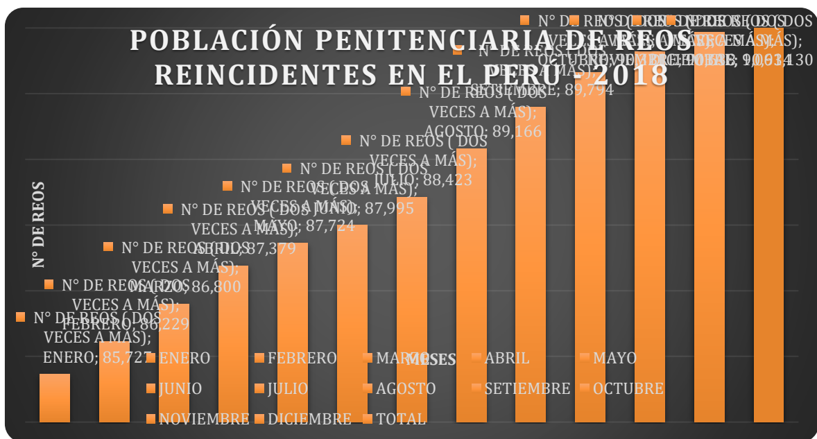
GRAFICO N° 01