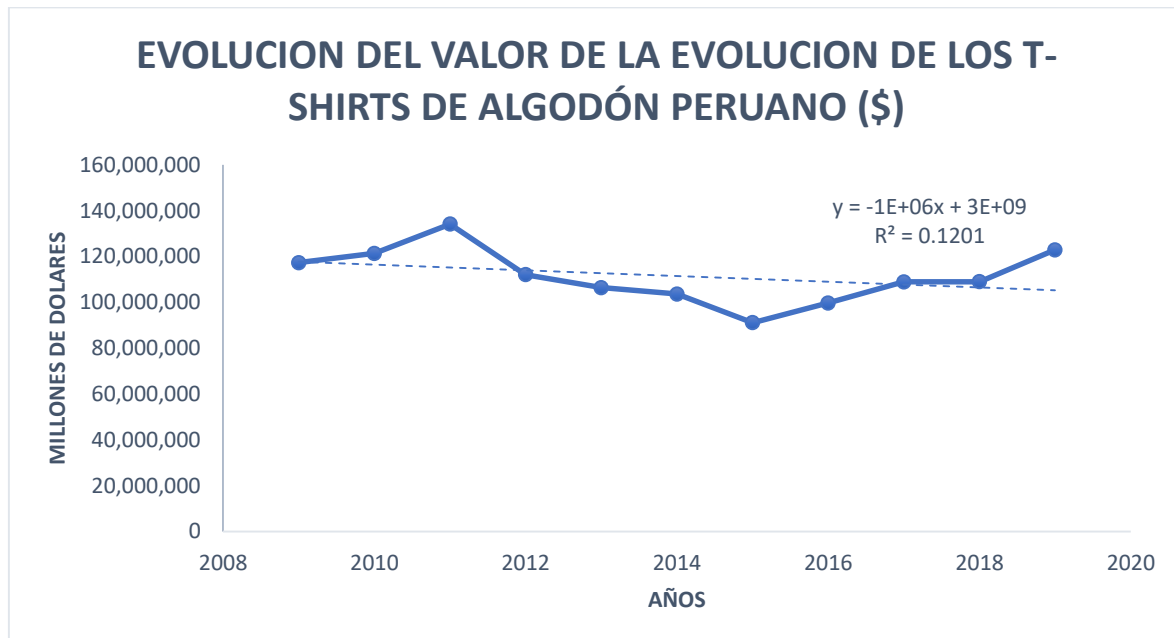
Figura 2. Valor de Exportación de t-shirt de algodón peruano hacia Estados Unidos tras el TLC 2009-2019

En la tabla 2, se muestra el valor de exportación anual expresada en dólares ($) por cada tonelada de t-shirt de algodón peruano exportada hacia Estados Unidos tras el TLC 2009-2019. Asimismo, se observa que el año que más se exportó fue en el 2011, donde se superó los 134 millones de dólares, ya que en el 2015 hubo una baja de exportaciones de -12% superando los 9 millones exportado, en el 2016 y 2017 mostró un ligero crecimiento de 9% respectivamente y en el 2019 tuvo un ascenso con una variación de 13%, con 122 millones de dólares.