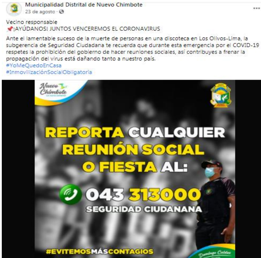
Figura 6. Ficha de observación correspondiente a la publicación de agosto