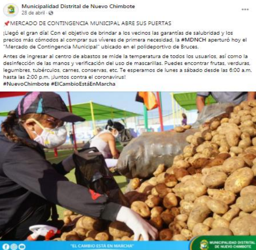
Figura 2. Ficha de observación correspondiente a la publicación de Abril