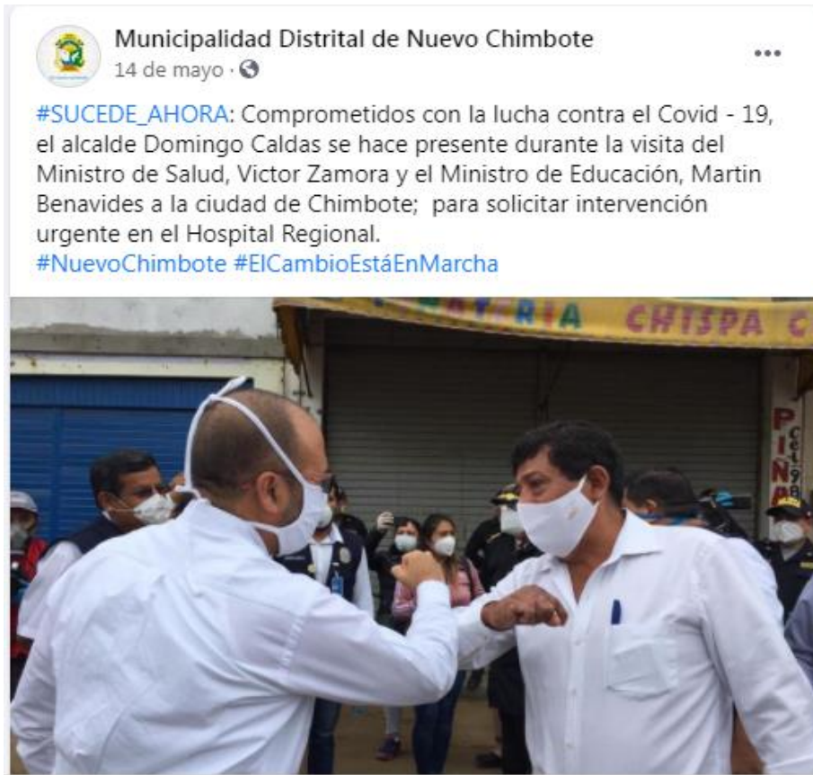
Figura 3. Ficha de observación correspondiente a la publicación de Mayo