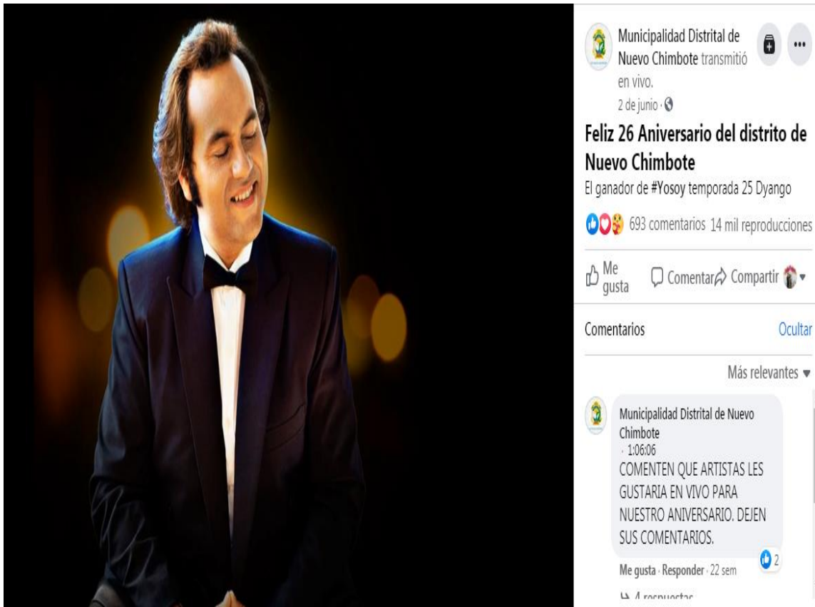
Figura 4. Ficha de observación correspondiente a la publicación de Junio