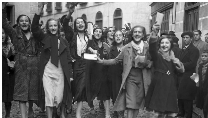
Mujeres y el voto

Nota. El gráfico representa con papeletas de voto por primera vez en España.